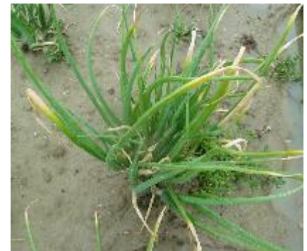
Botrytis squamosa - Photos CA 31

Conditions favorables à son développement : L'infection est favorisée par des périodes très humides et plutôt fraîches (températures avoisinant les 18°C avec un optimum de germination vers 14°C).