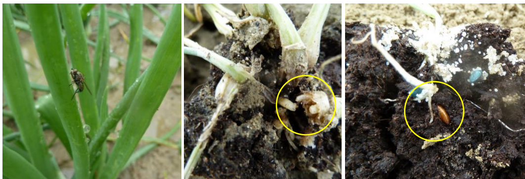
Mouche de l'oignon : adulte, larves, pupes

Symptômes : Les premiers symptômes sont un jaunissement des feuilles qui finissent par flétrir avec une pourriture à la base du collet. Quand on arrache la plante, on voit distinctement les larves au niveau du bulbe et du plateau racinaire. En fin d'attaque, on retrouve les pupes, en creusant, au niveau des racines.