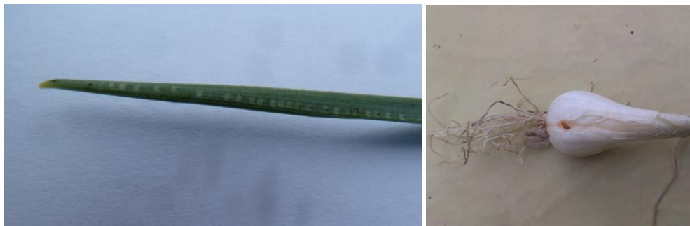
Mouche mineuse : piqûres, pupes

Les allium étant de petite taille, on assiste à des déformations de feuille.