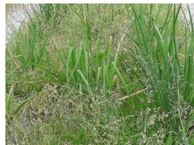
Envahissement par les adventices

De fait, les producteurs en conventionnel, sur des surfaces significatives, ne peuvent pas se reposer uniquement sur la chimie et doivent y associer a minima du désherbage mécanique et partir de parcelles relativement « propres » avec recours au faux-semis (voir la fiche technique du CTIFL ICI )