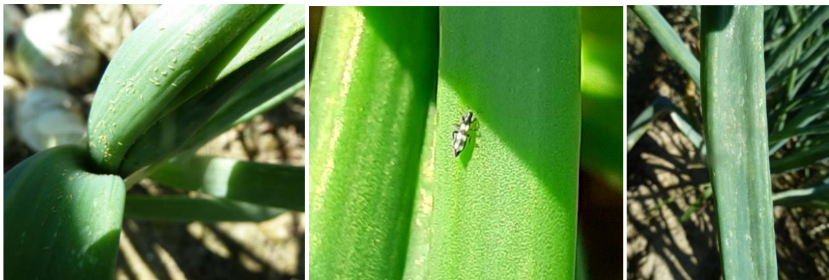
Thrips : larves, larves et Aeolothrips intermedius , dégâts

Biologie : L'hivernation se fait sous forme adulte et larvaire dans divers abris (débris végétaux, charpentes d'abris, sol, cultures de plein champ, allium sauvage ...). Des conditions climatiques hivernales défavorables au bon développement des thrips entraînent ainsi de faibles périodes de vol entre mai et juin. La période des vols intensifs commence fin juillet et peut durer jusqu'à début septembre.