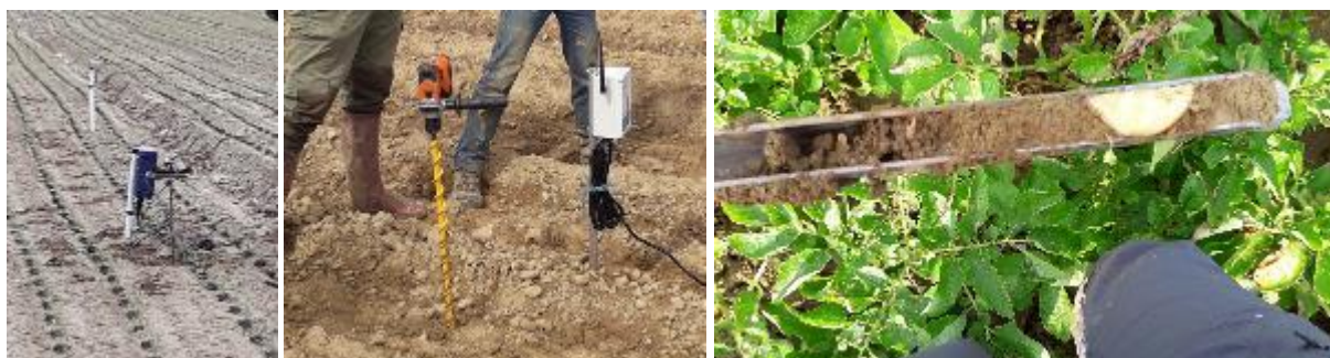
Sondes tensiométriques connectées, sonde capacitive connectée, humidité du sol sur 25 cm à l'aide d'une gouge

* Pour être utilisée sur une culture, les données de l'ETP (Evapo Transpiration Potentielle) doivent être corrigées par un coefficient de rationnement qui tient compte de la culture et de son stade végétatif.