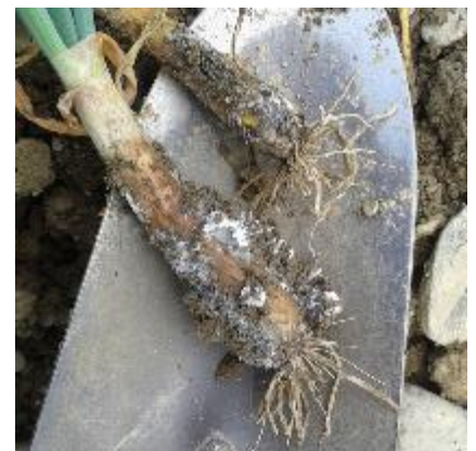
Pourriture blanche - Photo CA 65

C'est un champignon capable de s'attaquer à de nombreux hôtes (plus de 400 espèces végétales différentes, cultivées ou adventices) notamment des