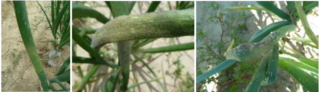
Mildiou : halo jaune, duvet gris violacé, dessèchement - Photos CA 31