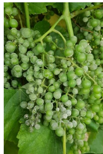
Symptômes d'oïdium sur Gros Manseng – Photo : CA32

Résistance : l'oïdium présente des résistances vis-à-vis de certains produits phytosanitaires. Il est important de les connaître et d'adapter son calendrier de traitement en fonction de ce risque de résistance. Pour en savoir plus, consultez la note nationale en cliquant ICI ou le site R4P en cliquant ICI .