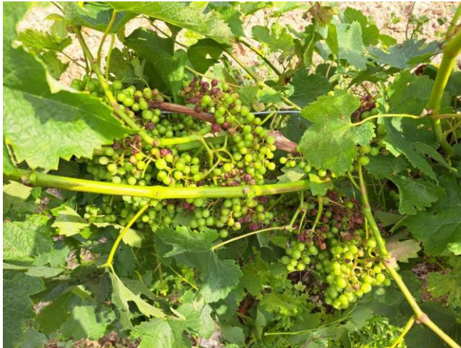
Symptômes de mildiou sur grappes (rot brun)