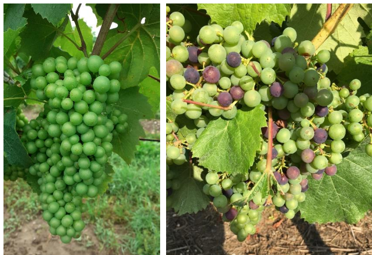
Stade 33 : Fermeture de la grappe Stade 35 : début véraison Photo CA8, Vivaloalie 46 – stades selon échelle Eichhorn et Lorenz