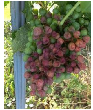
Echaudage sur grappes

Les journées chaudes de la semaine dernière ont engendré de l'échaudage sur tous cépages.