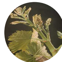
Stade 15 : Boutons floraux agglomérés