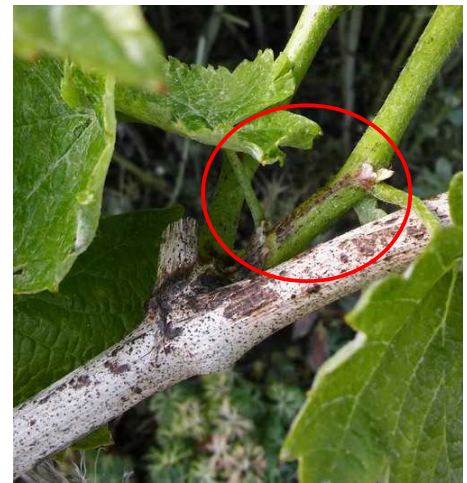
Excoriose: Apparition des premières lésions à la base des rameaux de l'année

Des dégâts sont toujours visibles en tous secteurs.