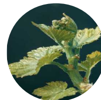
Stade 12 : Inflorescences visibles