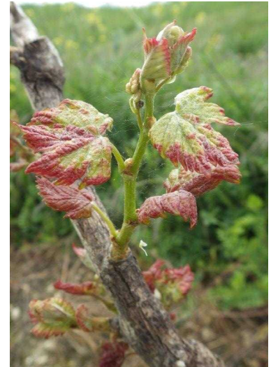
Erinose : Gales sur feuilles jeunes de Muscadelle

Évaluation du risque : Les symptômes sont précoces et généralisés. Et des cas d'attaques graves sont même déjà visibles. La pression est importante pour ce début de saison. Surveillez l'évolution des dégâts.