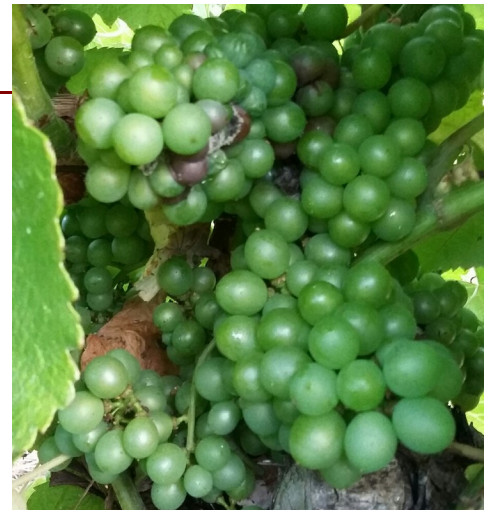
Botrytis : début de foyer sur Négrette