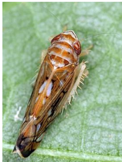
Adulte de Scaphoideus titanus

Des symptômes sont d'ores et déjà visibles.