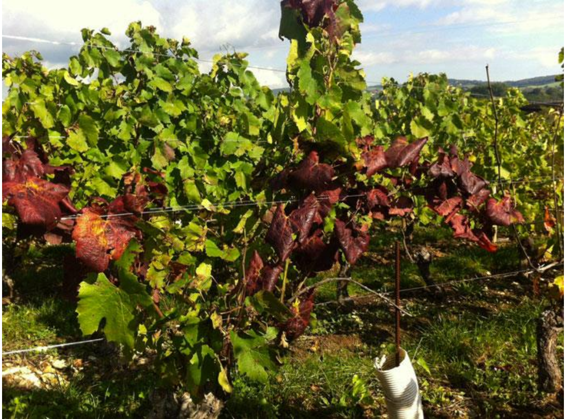
Symptômes de Flavescence