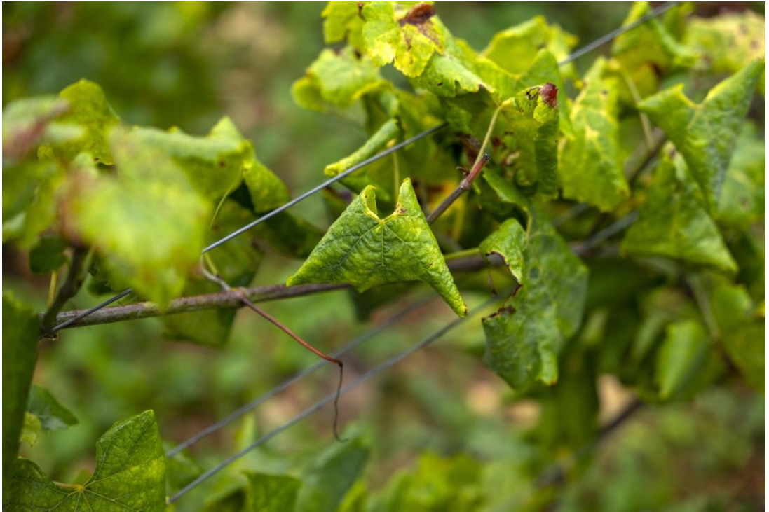
Symptômes de Flavescence