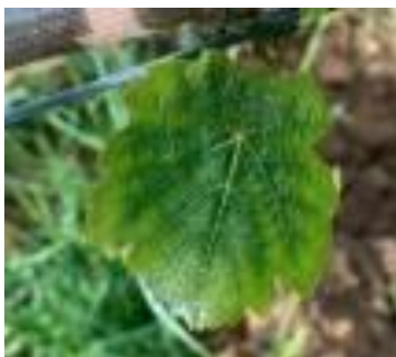
Carence en potasse

Des carences potassiques et magnésiques sont observées sur le vignoble.