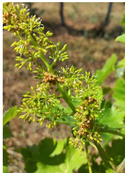
Glomérules sur grappes-photo CA81

Les diffuseurs doivent être posés au plus vite.