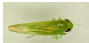
Adulte de cicadelle verte – IFV