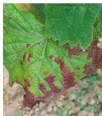
Grillure sur feuille – photo CA46