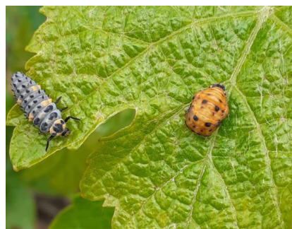
Larve et nymphe de coccinelle

La biodiversité est toujours visible dans le vignoble avec de nombreuses coccinelles observées.