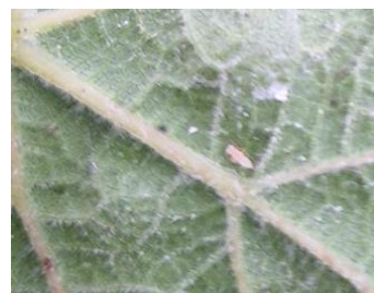
Larve de cicadelle verte – Vivalie

Les symptômes causés sont appelés des grillures. Il s'agit de rougissement sur cépages rouges et de jaunissement sur cépages blancs délimités par les nervures. Ces rougissements/jaunissements partent du bord de la feuille et progressent vers le centre. Par la suite, les parties colorées peuvent se dessécher.