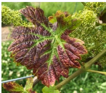
Carence en magnésie