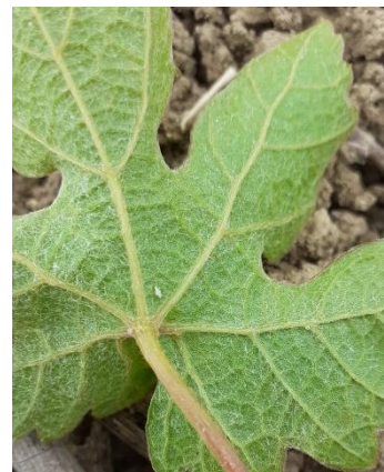
Larve (L1) de Scaphoideus titanus –photo CA81

L'arrêté préfectoral est publié sur le site de la DRAAF, retrouvez-le en cliquant ICI