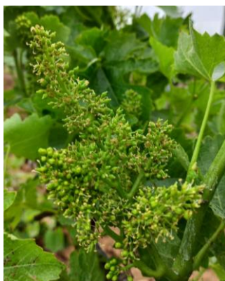
Stade 25 : Mi-floraison

Les observations montrent que nous sommes au stade « Grain de plomb » sur plupart des parcelles.