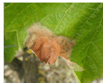
Botrytis : Symptômes sur feuille