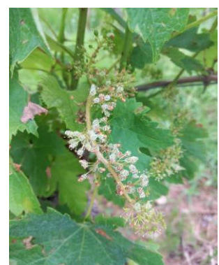
Symptôme de mildiou sur feuille et sur grappe