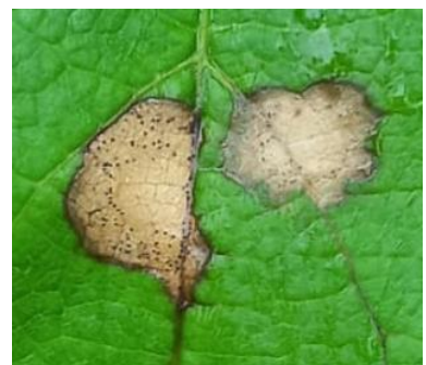
Tâches de black-rot