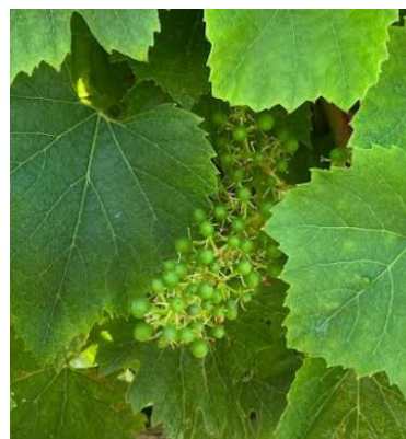
Stade 29 : Grain de plomb

stades selon échelle Eichlorn et Lorenz