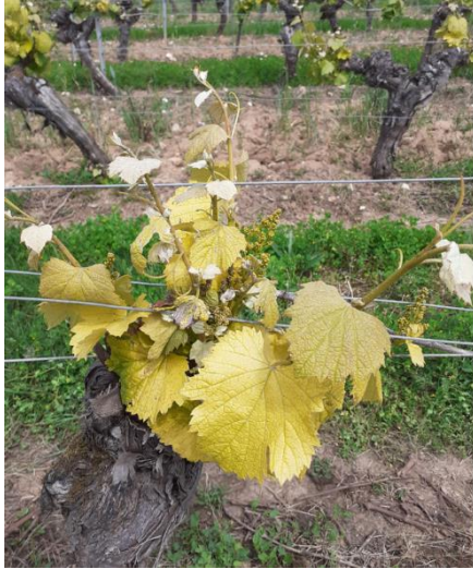
Chlorose : Symptômes sur feuille – photo CA46

Des symptômes de cloroses (Carence en Fer) sont observés.