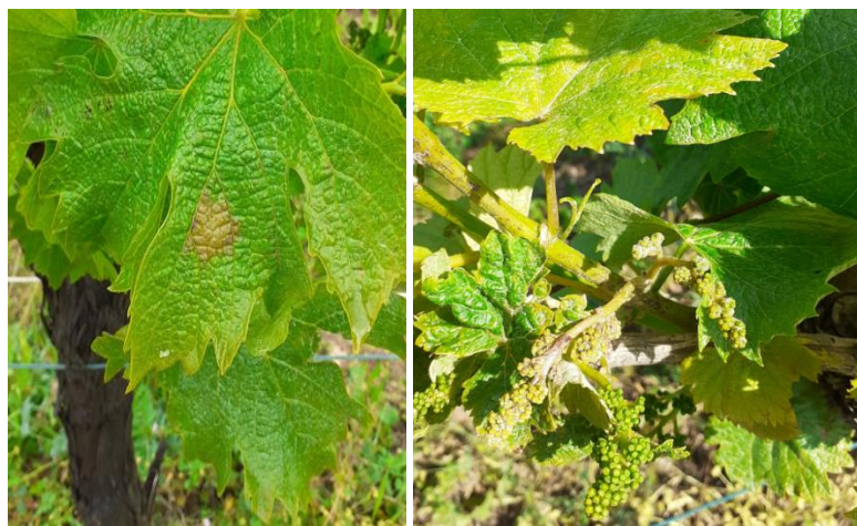
Tâches de mildiou sur feuille et sur grappe

Techniques alternatives : L'utilisation de moyens de bio-contrôle est possible et peut aider dans la gestion du mildiou. Consultez la liste des produits de bio-contrôle en clicquant ici .