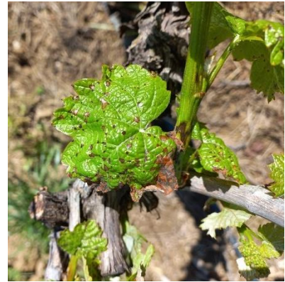
Phytotoxicité de désherbant

Des tâches de phytotoxicité au désherbant (type Spotlight) sont signalées.