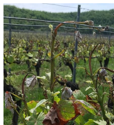
Stade 15 : boutons floraux agglomérés Stade 17 : boutons floraux séparés Apparition d'entre-cœurs (Albas)