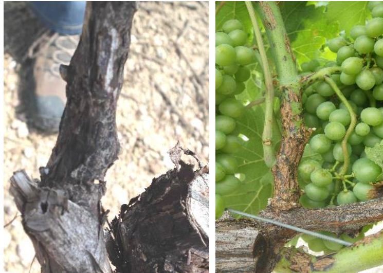
Excoriose : Symptômes sur bois et rameaux à gauche : Chancres d'excoriose sur bois d'un an à droite : Lésion sur jeune rameau

Mesures prophylactiques : Les bois porteurs de lésions doivent être éliminés autant que possible lors de la taille d'hiver