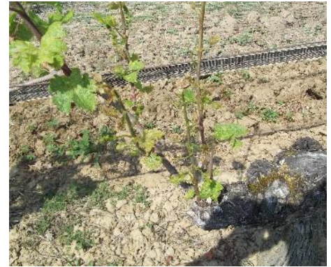
Acariose : Entre-noeuds raccourcis et feuillage gaufré

Évaluation du risque : Surveillez particulièrement les jeunes plantations et les parcelles âgées avec un débourrement lent qui se montrent plus sensibles aux attaques d'acariose. Les conditions de pousse active sont peu favorables à l'expression des dégâts du ravageur.