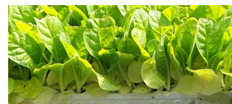
Tabacs en cours de plantation - (Crédit Photo : N. BARRET - TGA)