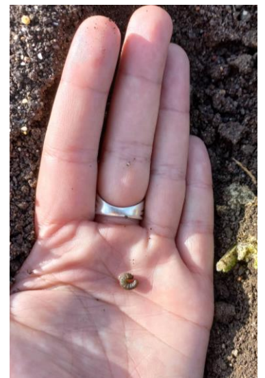
Noctuelle terricole présente sur pied de tabac