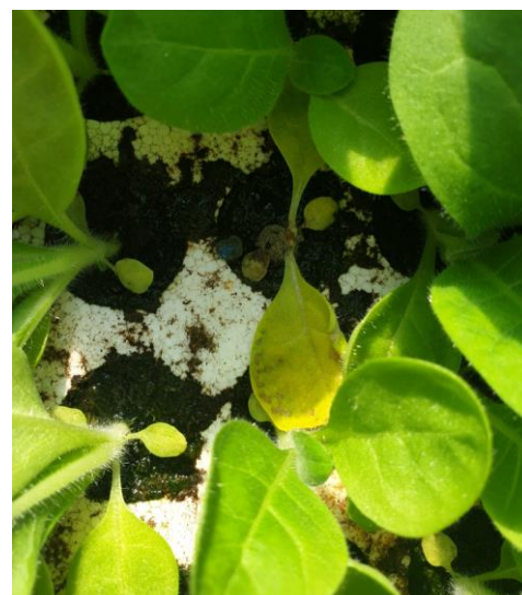
Dégâts de pourriture grise sur semis de tabacs - (Crédit Photo : D. SAUREL - TGA)

En tour de plaine, on note sa présence allant de 3 à 4 ha sur les parcelles de Sardieu (38) et Beaurepaire (38). Sur 12 ha avec des dégâts de moins de 20 %, le Botrytis se propage plus rapidement sur 9 ha avec une fréquence d'attaque de plus de 20 % dans certaines zones du secteur de Schnersheim (67). Il a aussi été identifié sur 35 ha dont 16 ha avec des dégâts de moins de 20 % pour Vivonne (86). Enfin, des symptômes importants ont été observés sur le secteur de Chemillé (49) sur 25 ha dont 6 ha avec une fréquence d'attaque de moins de 20 %.