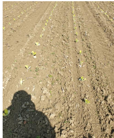
Renouée persicaire avec liserons (à gauche), lampourde (milieu) et chénopodes (à droite) près des semis plantés - (Crédit Photos : S. SEGUIN – Périgord Tabac / D. SAUREL – TGA)