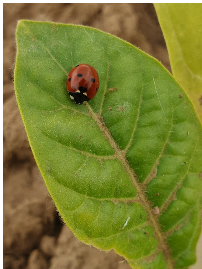
Coccinelle sur feuille de tabac

Pour les parcelles en tour de plaine, les coccinelles sont présentes sur 5 ha ainsi que des syrphes sur 2 ha pour le secteur de Thuret (63). On remarque aussi la présence sur 1 ha de chrysopes et hémérobes pour la zone de Castelnau-Montratier (46).