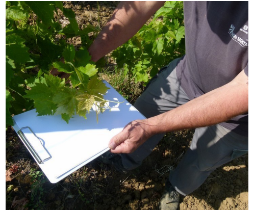
Thrips- Technique de battage des grappes

Le battage doit se réaliser sur une surface blanche rigide. Battre plusieurs fois les grappes et/ou les pousses terminales et attendre quelques secondes. Observez le déplacement des thrips jaune orangé avec une taille de 1mm maxi.