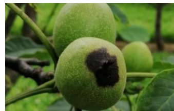
Symptôme de bactériose

Un développement d'antracnose à Colletotrichum sp. peut parfois s'ajouter sur les taches apicales provoquées par la bactériose qui finissent alors par se crevasser.