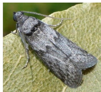
Ectomyelois ceratoniae