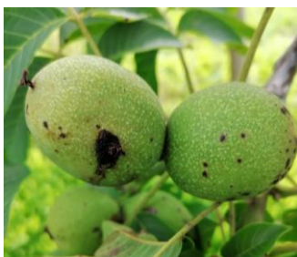
A gauche, dégât de larve de carpocapse

Concernant les observations en parcelle, très peu de dégâts sont observés sur les noix dans la majorité des vergers.