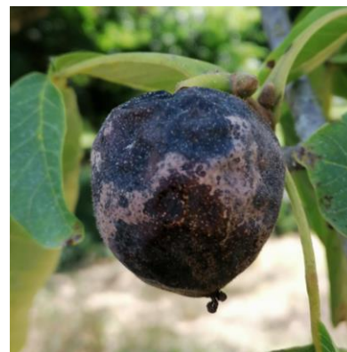
Colletotrichum sp. sur noix

En effet, les symptômes qui apparaissent en ce moment peuvent être dus à Gnomonia leptospyla mais aussi à Colletotrichum sp.