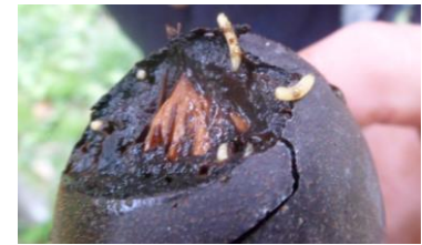
Larves de Rhagoletis completa