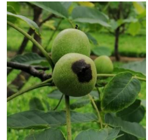
Symptôme de bactériose

Des taches de bactériose sont observées sur des feuilles et des fruits dans plusieurs secteurs.