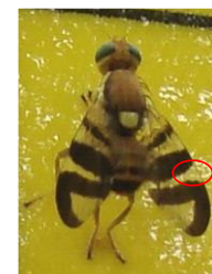
Rhagoletis completa

Des larves sont observées depuis début août dans les secteurs précoces et intermédiaires.