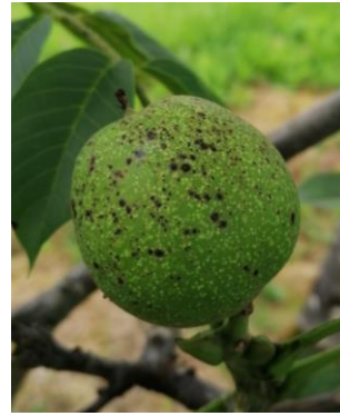
Symptômes d'antracnose sur feuille et sur fruit