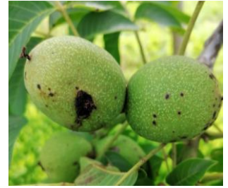
A gauche, dégât de larve de carpocapse

D'après les données du réseau de piégeage du BSV et celles fournies par les coopératives partenaires, les captures sont en baisse depuis la fin du mois de juillet . Le pic du deuxième vol semble avoir eu lieu autour du 20/07, mais le manque de données de piégeage perturbe l'analyse de la courbe ci-dessous.