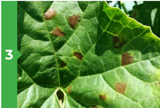
3 Symptômes sur feuille face supérieure