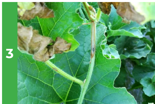
3 Symptômes sur tige