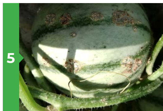
5 Symptômes sur fruit