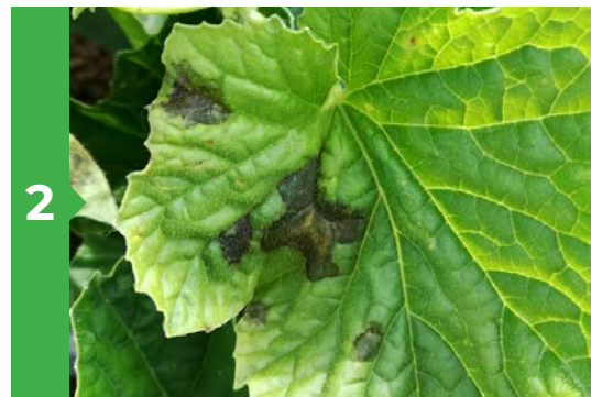
Symptômes sur feuille