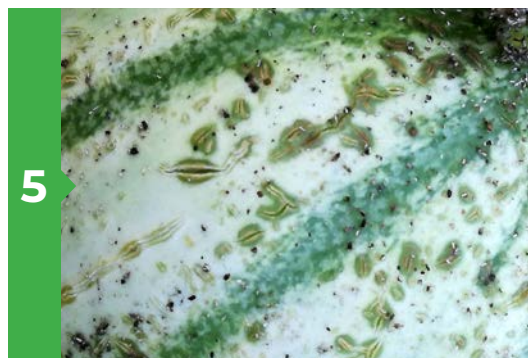
Symptômes sur fruit