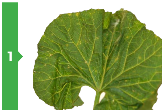
1 Symptômes sur feuille face supérieure

Le champignon se développe lors de conditions climatiques froides et humides (optimum de germination des spores de 17 à 20°C). Son cycle est rapide, moins de 7 jours.