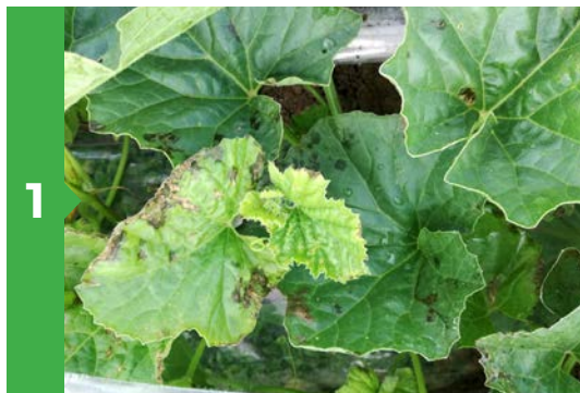
Symptômes sur feuille

La bactérie peut se conserver dans le sol et les débris végétaux ou dans l'eau d'irrigation. Elle se dissémine sous l'influence de l'eau et se développe lors de conditions climatiques fraîches et humides.