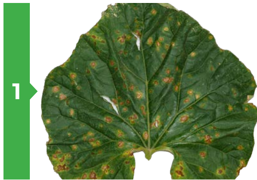
1 Symptômes sur feuille face supérieure

Température élevée et pluviométrie sont favorables à son développement. Optimum de contamination de 25 à 28 °C.