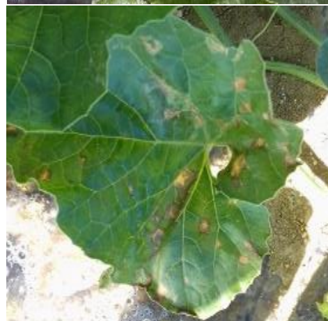
En haut : Cladosporiose – En bas: Bactériose sur feuilles