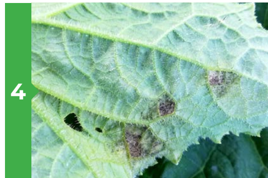
4 Symptômes sur feuille face inférieure