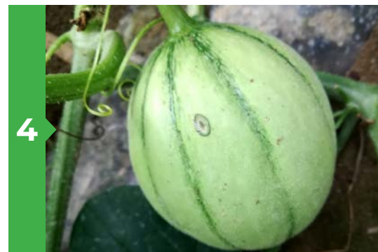
4 Symptômes sur fruit