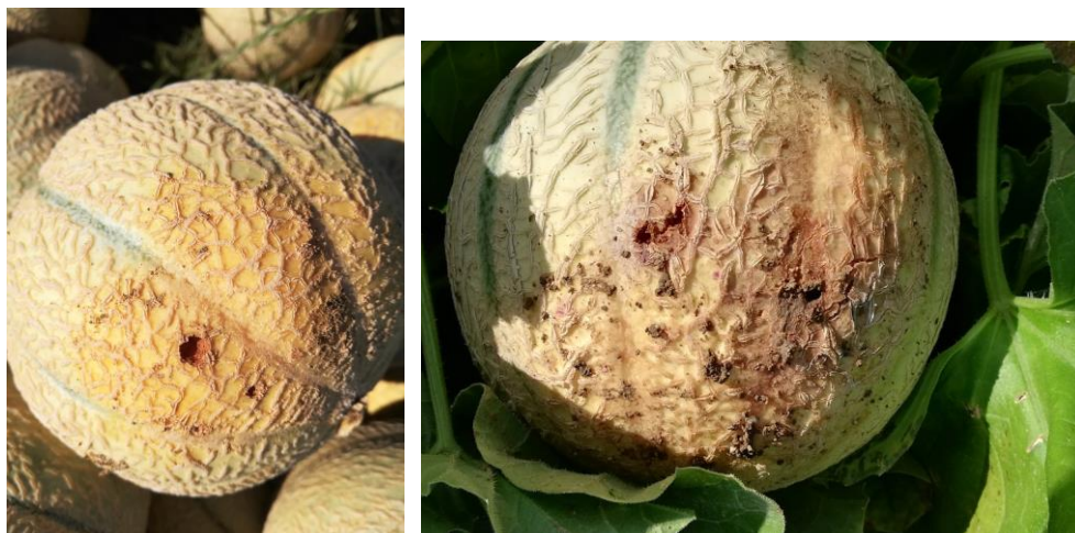
Perforations de larves de taupins sur fruit.

Des dégâts de perforations de fruits sont présents au niveau du contact terre-sol : larves de taupins. Ces symptômes sont en augmentation.