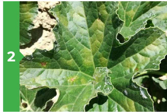
2 Symptômes sur feuille face supérieure