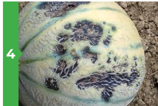
Symptômes sur fruit