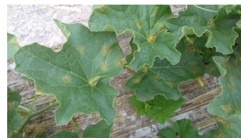
Symptômes de mildiou sur feuilles

Il apprécie particulièrement les fortes hygrométries survenant en périodes de brouillards, de rosées, de pluies et d'irrigations par aspersion. La présence d'eau libre sur les feuilles est indispensable à l'infection qui a lieu, par exemple, en 2 heures si la température est située entre 20 et 25°C. Elle peut se produire pour des températures comprises entre 8 et 27°C, l'optimum se situant entre 18 et 23°C. Ce bioagresseur supporte bien les températures élevées : plusieurs jours à 37°C n'entament pas sa viabilité, les températures nocturnes plus fraîches lui permettant de survivre.