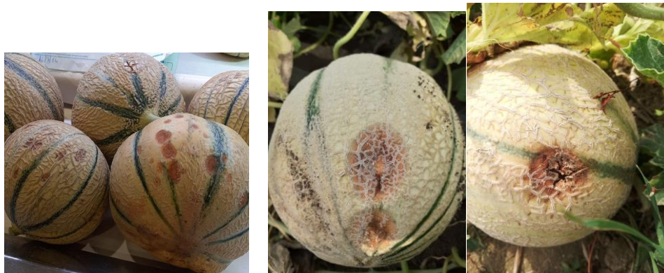
Anthracnose sur fruits.

http://ephytia.inra.fr/fr/C/7679/Melon-Anthracnose-Colletotrichum-orbiculare