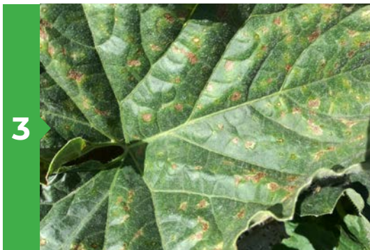
3 Symptômes sur feuille face supérieure