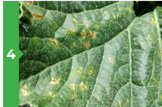
4 Symptômes sur feuille face supérieure