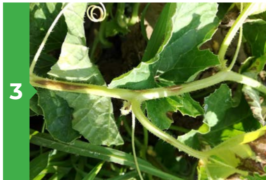
Symptômes sur tige