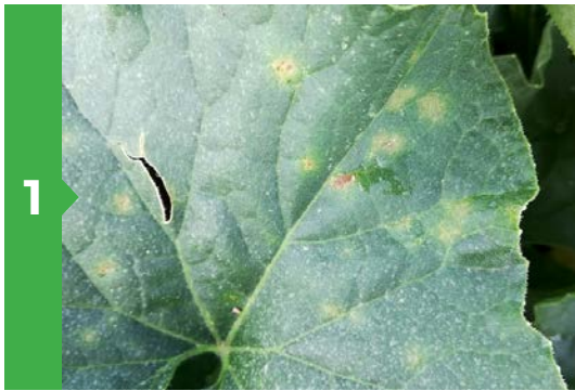
1 Symptômes sur feuille face supérieure

Le mildiou supporte les températures élevées. Il est un parasite obligatoire.