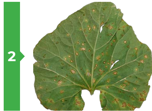
2 Symptômes sur feuille face inférieure