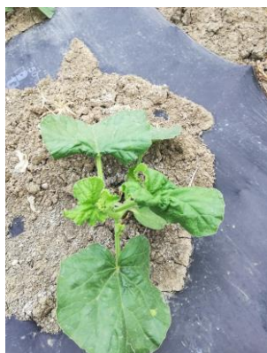
Pucerons sur jeune plant.

Des auxiliaires sont dénombrés : coccinelles surtout. Les foyers ne semblent pas se développer avec l'apparition des auxiliaires