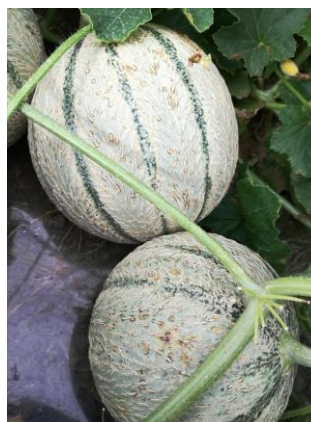
Bactériose sur fruits

Des symptômes de cladosporiose « secs » peuvent être présents sur fruits.