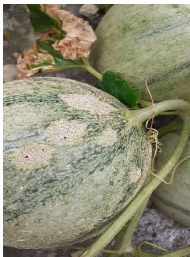
Symptôme de cladosporiose

Des symptômes de cladosporiose « secs » peuvent être présents sur fruits.