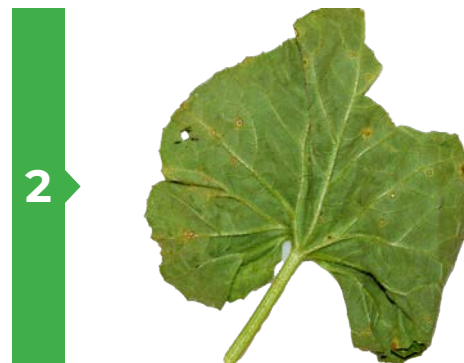
2 Symptômes sur feuille face inférieure