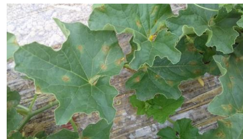
Symptômes de mildiou sur feuilles

REPRODUCTION DU BULLETIN AUTORISÉE SEULEMENT DANS SON INTÉGRALITÉ (REPRODUCTION PARTIELLE INTERDITE)