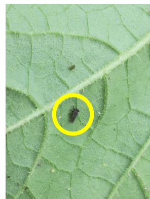
Larve de coccinelle.