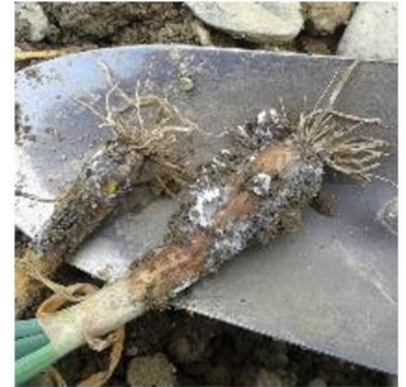
Pourriture blanche

son optimum thermique se situe sur une plage de température de 17 à 20°C. Il est favorisé par les périodes humides et pluvieuses et attaque les tissus ayant atteint un développement avancé.