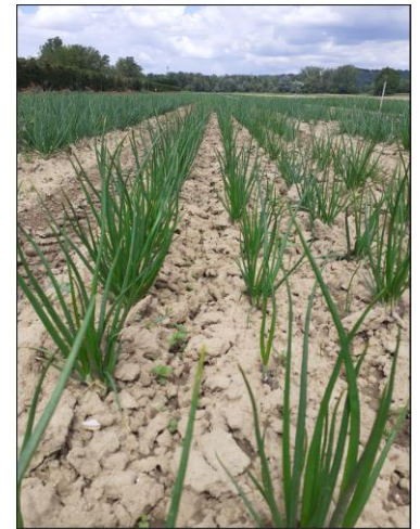
Plantation d'oignons

Sur parcelle flottante : mildiou généralisé sur une parcelle en région toulousaine (plantation d'automne).