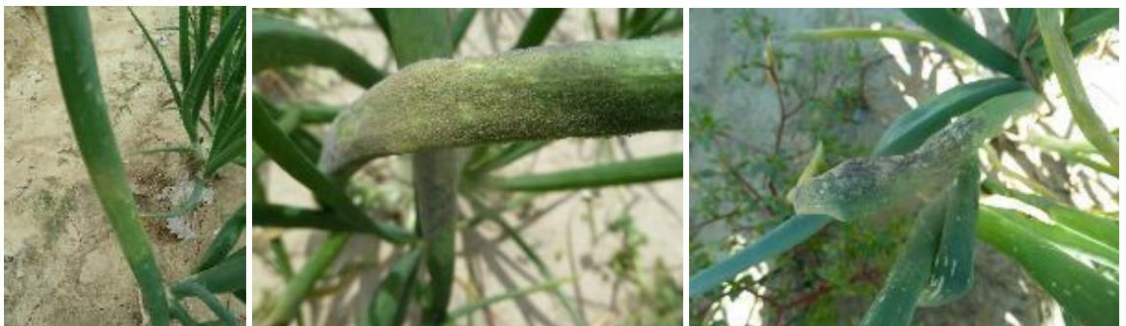
Mildiou : halo jaune, duvet gris violacé, dessèchement