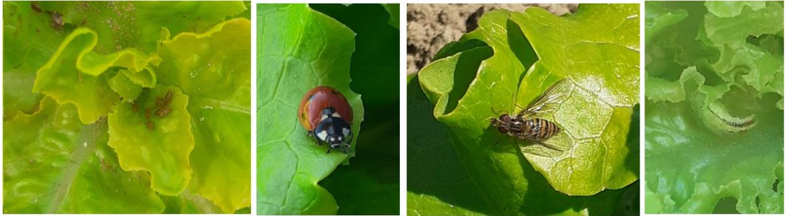
Pucerons sur feuille de chêne et auxiliaires : Coccinelle, Syrphe et larve de syrphe

Il n'est pas nécessaire d'intervenir tant que ce ravageur n'est pas présent sur vos cultures. Si vous détectez un pied avec des pucerons, observez plus attentivement les pieds alentours et la présence ou non d'auxiliaires.