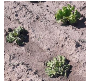
Pythium - photo CA31

A surveiller en cas de forte humidité du sol et températures avoisinant 20-24 °C.