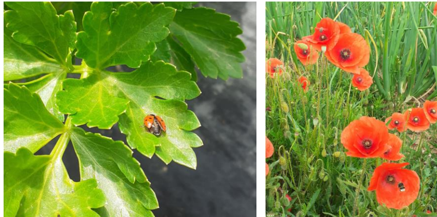
Coccinelle sur feuille de céleri - Coquelicots en bordure de parcelle avec abeille et bourdon en cours de pollinisation

Les auxiliaires sont présents (syrphes : larves et nymphes, coccinelles : larves et adultes...).