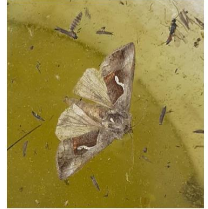
Papillon Autographa gamma Photo CA31

Évaluation du risque : Le risque augmente, surveillez vos parcelles.