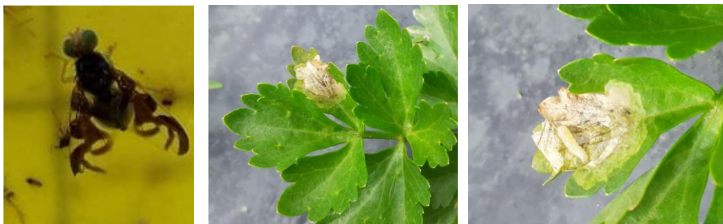
Mouche du céleri : adulte, dégât et larve

La corrélation entre les vols et les niveaux d'attaque observés ne sont pas systématiquement corrélés mais cela donne tout de même une indication.