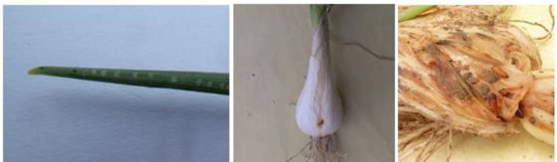
Mouche mineuse : piqûres nutritionnelles, pupes - Photos CA 65

Évaluation du risque: Nous sommes sur la période de vol de printemps. Risque présent. Surveillez vos parcelles.