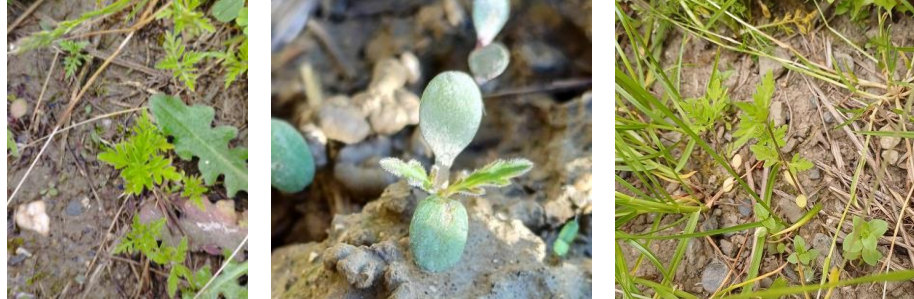
Plantules d'Ambrosie à feuille d'armoise, de gauche à droite : Lycée Agricole Capou (82) le 6 mai 2024, nord Gers le 14 avril 2024, commune de Horgues (65) le 24.04.24

En cas de présence d'ambrosies dans vos parcelles et sans herbicides de prélevée, intervenez avant 2 feuilles avec une herse étrille ou une houe rotative. Dans le cas d'un désherbage au semis, une intervention à 6 feuilles maximum est conseillée, mécanique par exemple.