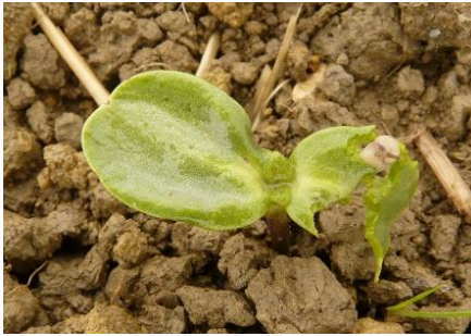
Dégâts de limace sur jeune pied de tournesol

La sensibilité du tournesol s'étend jusqu'à l'apparition de la deuxième paire de feuilles.