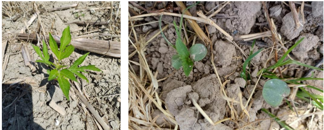
Germination d'Ambrosie trifide – St-Sernin Les Lavour (81) (13 mai 2024) stade cotylédons (avril 2024) –