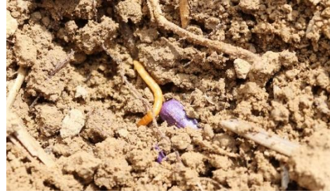
Présence de taupin à proximité d'une graine de tournesol,

La protection réalisée dans la plupart des situations à risque (situations avec pression historique) permet un bon contrôle mais empêche de refléter la pression réelle.