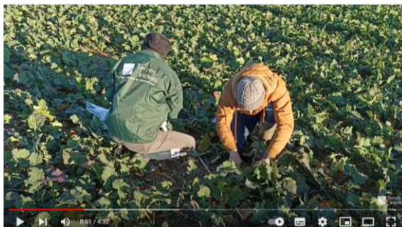
Lien vidéo pesée biomasse Terres Inovia

Il est toujours temps de réaliser la pesée biomasse sortie hiver afin de calculer la juste dose d'apport d'azote à la culture.