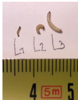
Stades larvaires de grosses altises