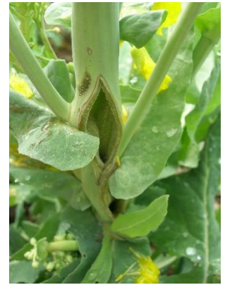
Dégât engendré par le charançon de la tige du colza lors de la ponte.

Cette semaine, on observe toujours des charançons de la tige du chou dans les cuvettes, en moyenne 4,7/piège. Seul 1 individu de charançon de la tige du colza est piégé dans une parcelle de l'Aude. Hors réseau, d'autres piégeages de faible intensité ont pu être observés dans plusieurs départements.