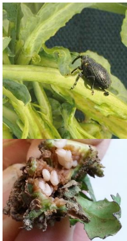
Charançon du bourgeon terminal adulte (en haut) et larves (en bas), qui provoquent la nuisibilité par une absence de tige principale au printemps