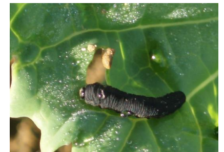
Larve de tenthrède de la rave sur colza