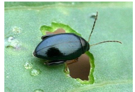
Grosse altise sur colza