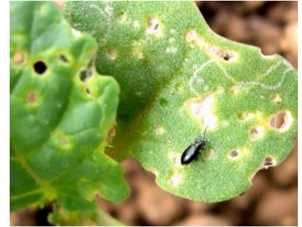
Petite altise sur colza

Évaluation du risque : Restez vigilants jusqu'au stade six feuilles, stade où le collet sera plus vigoureux.