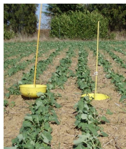
Cuvette jaune en situation

8 pieds sur 10 avec morsures et 25% de la surface foliaire atteinte.