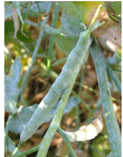
Oïdium sur siliques

Seuil indicatif de risque : Seuls les symptômes sur les plantes (tâches étoilées) constituent un risque. La nuisibilité de l'oïdium sera d'autant plus forte que ces tâches étoilées apparaissent tôt sur les tiges, les feuilles et/ou les jeunes siliques.