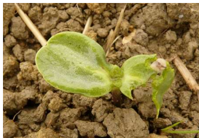
Dégâts de limace sur jeune pied de tournesol

Les données issues du modèle limaces de l'ACTA placent l'indice de risque à différents niveaux selon les sites retenus. Ce modèle se base sur les données climatiques par année pour établir un risque.