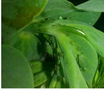
Pucerons verts sur pois

Période de risque : de 12 feuilles à fin floraison