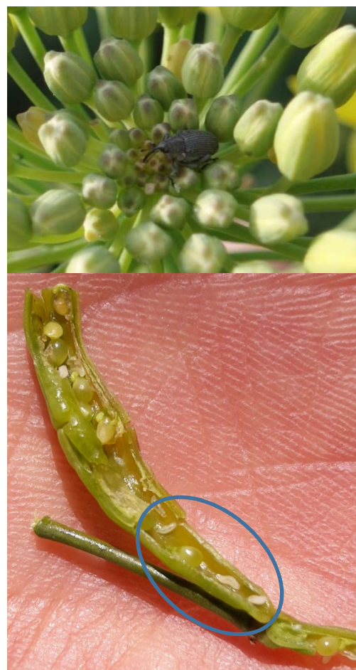
Charançon des siliques et larves de cécidomyies

Rappel : le comptage se fait sur une moyenne de plantes consécutives (4 fois 5 plantes par exemple). Elle doit donc se faire sur des plantes avec ET sans charançons des siliques.