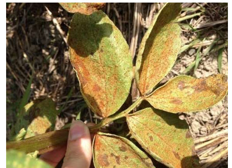
Rouille sur fève Uromyces fabae (photo Terres Inovia).

Des symptômes de rouille sont également notés dans le réseau. Les conditions actuelles ne sont pas propices à l'apparition de symptômes sur les prochains jours. Attention la période de risque n'est pas terminée, la surveillance doit se poursuivre.