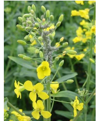
Manchon de pucerons cendrés

Les retours de parcelles fortement atteintes sont plus rares ces derniers jours.