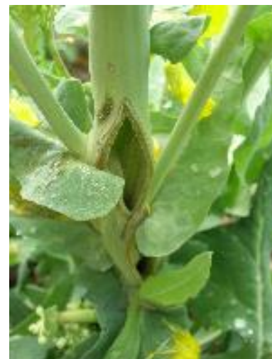
Dégât engendré par le charançon de la tige du colza

Pour rappel, la cuvette jaune est l'outil indispensable pour le suivi des ravageurs du colza tout au long de la campagne (dès l'automne et jusqu'au printemps).