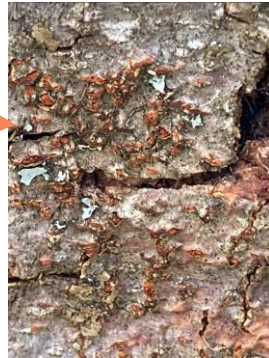
Pustules rouge-orangées : fructifications du champignon