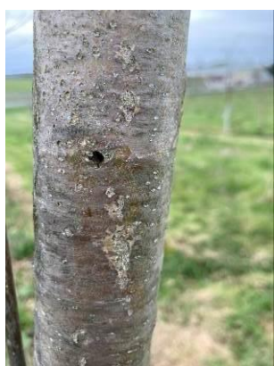
Sortie des scolytes