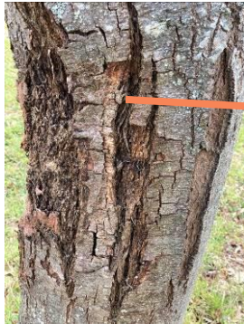
Chancre sur tronc