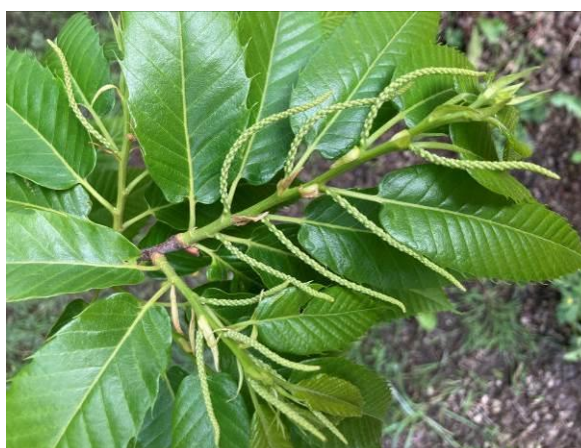
Marigoule (Châtons mâles visibles) Lubersac (19)

ÉCOPHYTO RÉDUIRE ET AMÉLIORER L'UTILISATION DES PHYTOS