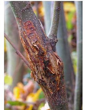
Chancre avancé, sur bois jeune

Sur des arbres plus âgés, la détection est moins visible : l'écorce se craquelle de façon longitudinale et se boursoufle.