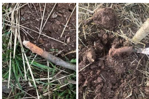
Dans le Cantal

Dégâts de campagnols terrestres sur le système racinaire de jeunes plants de châtaigniers.