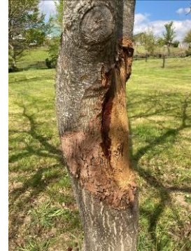
Chancre cureté avec bourrelet de cicatrisation en périphérie