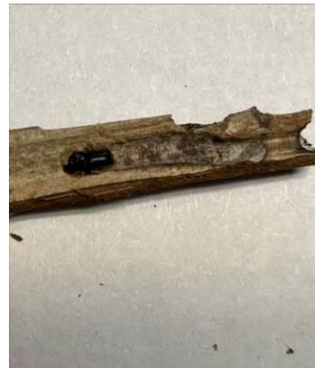
Scolyte adulte dans une galerie