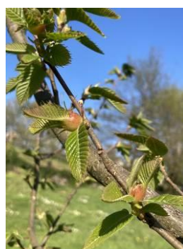
Marsol : galles sur bois d'un an