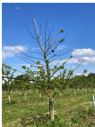
Dessèchement des branches

Activité visible sur les arbres jeunes faibles :