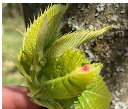
Bournette : petite galle rouge sur jeune feuille

Vol en cours des Torymus (parasite du cynips) qui sortent des galles sèches de l'année 2023. Les premières galles habitées par les jeunes larves de cynips peuvent être visibles.