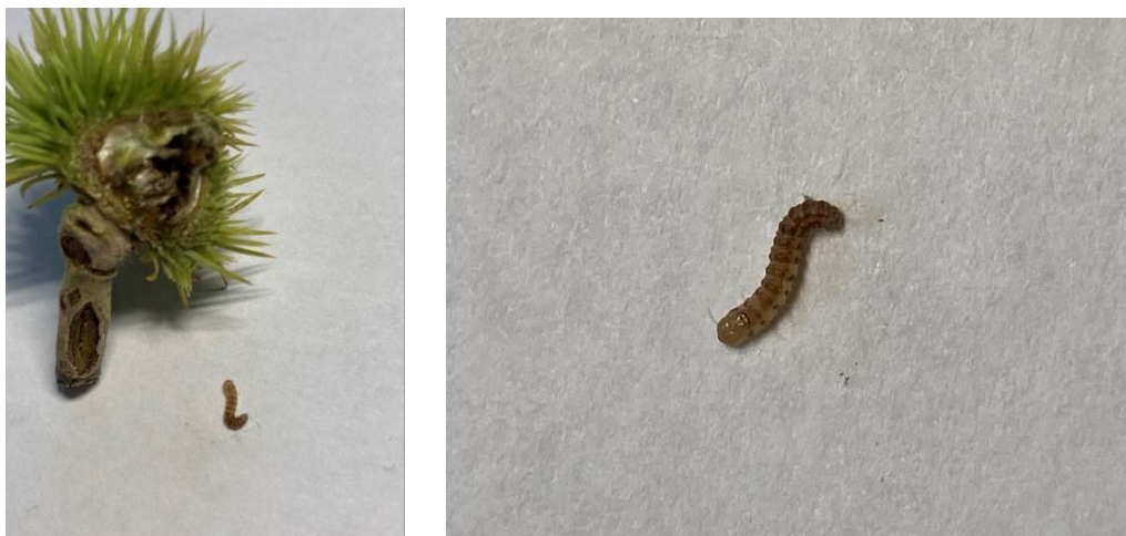
Jeune bogue de Bellefer ayant chutée de façon précoce et infestée par une tordeuse Le 27/07/2021 en Corrèze