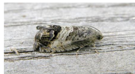
Papillon adulte (Imago) de carpacse de la châtaigne ( Cydia splendana )

Le vol a commencé il y a deux semaines dans les secteurs les plus précoces.