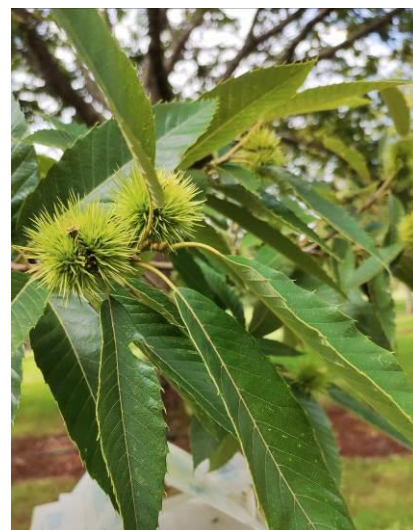
Bogue de Marigoule Dordogne – 26/07/2021

ÉCOPHYTO RÉDUIRE ET AMÉLIORER L'UTILISATION DES PHYTOS