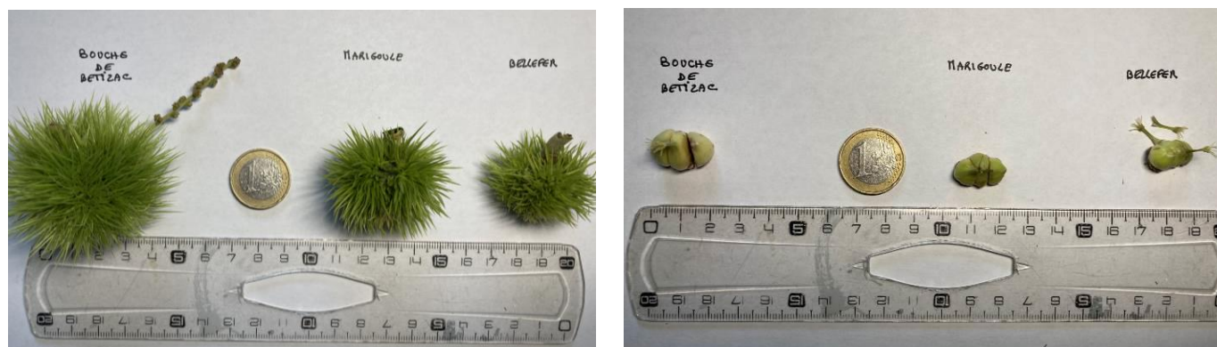
Bogues prélevées le 27/07/2021 en Corrèze

Grossissement des bogues et des châtaignes. Les amandes fécondées dans les châtaignes ne sont pas encore distinguables.