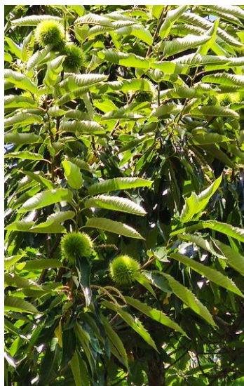
Bogues de Bouche de Bétizac Dordogne – 26/07/2021