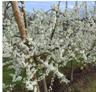
Prune américano-japonaise, variété Ruby Star, Stade F, Photo Jocelyne Pentor 2023