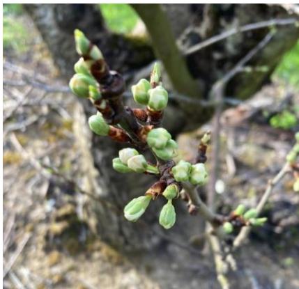
Prune Domestique, variété Reine-Claude, Stade D