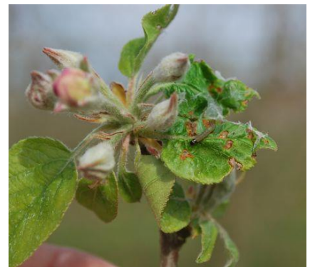
Dégâts et larve de capua avant fleur : feuilles de rosettes collées entre elles avec tissage blanc