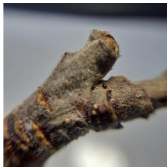
Œufs de pucerons cendrés, Photo CA82 2023