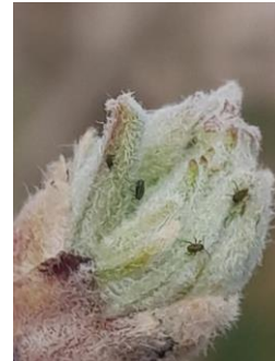
Fondatrices de pucerons verts, Qualisol 2023