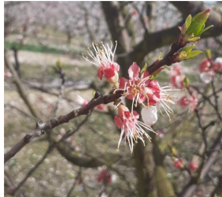
Abricotier, variété Wondercot, Stade G Photo CA82 2023