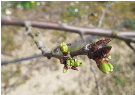
Prune Domestique, variété Reine-Claude, Stade C Photo CA82 2023