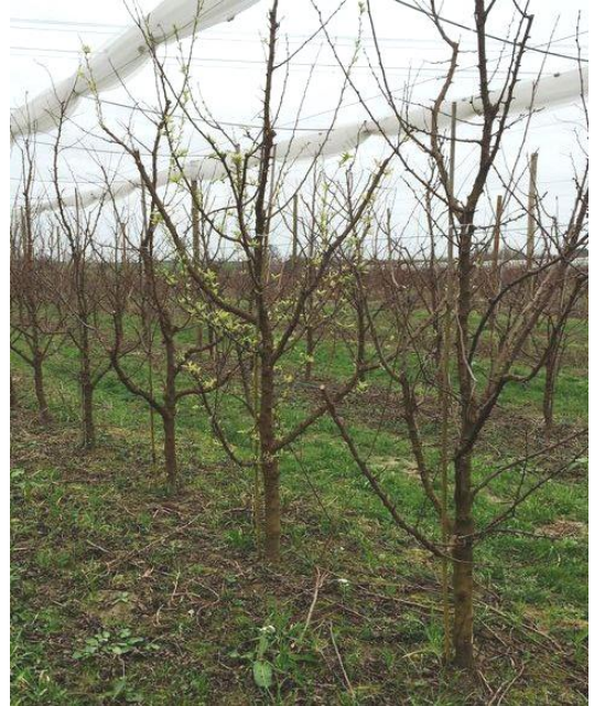
Arbre malade à feuillaison précoce

L'expression des symptômes est importante encore cette année en verger.