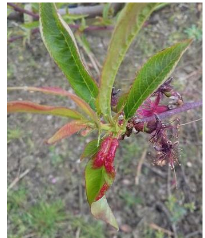
Cloque sur premières feuilles

Évaluation du risque : Risque moyen en cours. Le stade sensible est atteint sur toutes les variétés (au moins stade C). La période de risque cloque est en cours. Les températures sont adéquates pour la maladie et quelques précipitations de faible intensité sont prévues en fin de semaine. Il y a donc un risque de contamination potentielle de moyenne intensité en fin de semaine si la météo ne change pas.