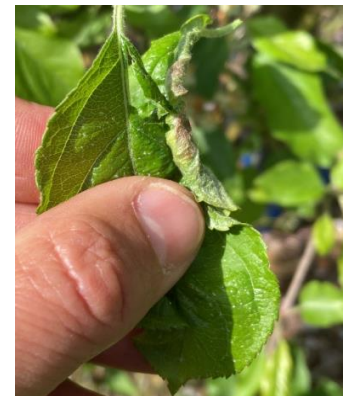
Dégâts de cécidomyie

Évaluation du risque : Période de risque en cours. Seuls les jeunes vergers sont exposés au risque cécidomyie. Faible pression.