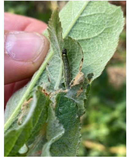
Dégâts et larve de capua sur pousse : feuilles collées entre elles avec tissage blanc

Mesures prophylactiques : la lutte par confusion sexuelle permet de limiter les populations et de diminuer l'usage des insecticides tout en améliorant l'efficacité de la protection. Les diffuseurs doivent être mis en place avant le début du vol (fin avril).