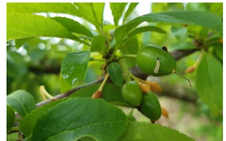
Hoplocampe, Photo 2023

Évaluation du risque : Risque faible en cours. Le vol et les éclosions sont terminés (ou dans la toute dernière partie des éclosions). Nous observons toujours quelques larves en activité. Elles devraient bientôt s'enterrer jusqu'au printemps prochain.