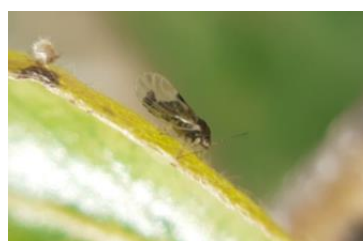
Psylle adulte