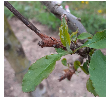
Chancre à nectaria - Photo CA82

Mesures prophylactiques et / ou techniques alternatives : Nettoyer les chancres sur les arbres contaminés. Supprimer les branches trop contaminées lors de la taille.