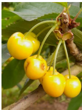
Dégât de punaise sur cerise