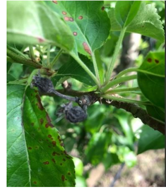
Black rot sur feuilles et momies

Évaluation du risque : Les périodes de pluie avec des températures douces sont favorables aux contaminations. Le risque est très lié à la parcelle.