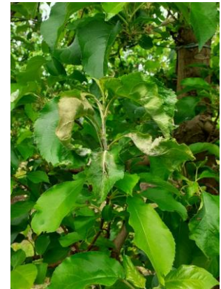
Pousse oïdiée ou « drapeau »

Mesures prophylactiques : La suppression des pousses oïdiées dès leur sortie permet de limiter les risques de repiquages.