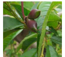
Fruit double, Photo CA82 2023

De nombreux fruits doubles, triples voir quadruples sont observés sur diverses espèces. Habituellement vu en cerisier, nous en voyons cette année sur des pêchers, nectarines et pruniers. Leur présence est le résultat des fortes chaleurs de l'été dernier au moment de l'induction florale.