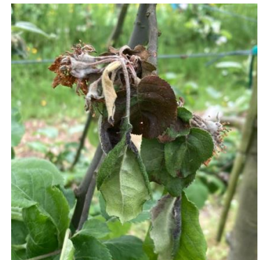
Pousse moniliée

Mesures prophylactiques : La suppression des pousses moniliées permet de limiter l'inoculum.