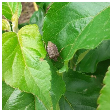
Adulte de punaise diabolique en verger Photo CA82