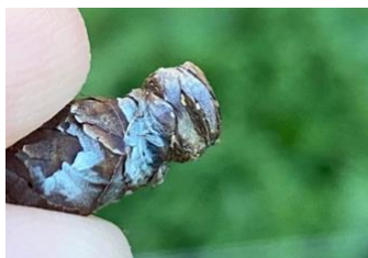
Œufs de psylles

Évaluation du risque : intensification des éclosions de la G2. Stade jeune larve majoritaire.