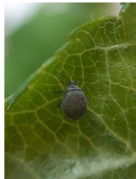
Fondatrice de pucerons cendrés

Nous observons également la présence de larves de syrphes dans certaines parcelles.