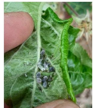
Foyer de pucerons cendrés