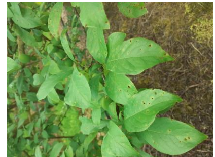
Taches et criblures bactériennes Photos CA82

On observe en verger de fortes sorties de symptômes de taches bactériennes sur feuilles en prunier japonais. On observe aussi des dégâts de xanthomonas sur fruits et des suspicions de pseudomonas sur fruits également.