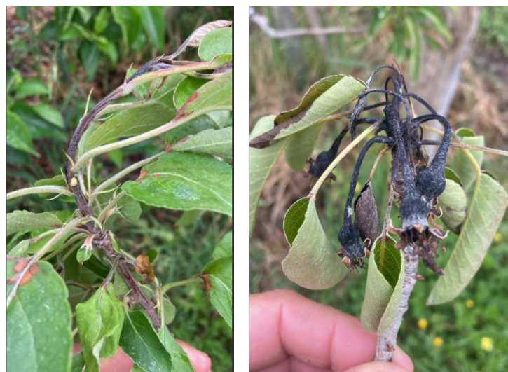
Symptômes de feu bactérien sur pousses (pommier à gauche, poirier à droite)