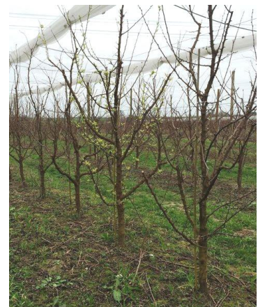
Arbre malade à feuillaison précoce

L'expression des symptômes est importante encore cette année en verger.