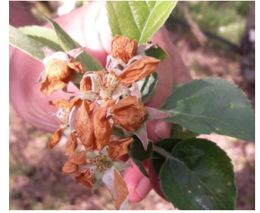
Dégâts d'anthonomes en « clou de girofle »

Évaluation du risque : fin de la période de risque