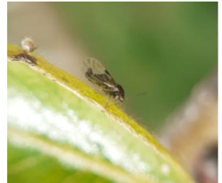
Psylle adulte

Évaluation du risque : absence de risque pour l'instant