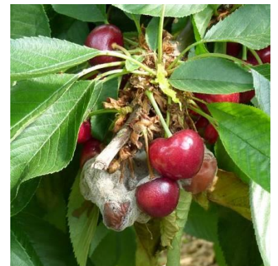
Foyer de monilia fruits

Évaluation du risque : Risque fort cette semaine sur les variétés qui seront récoltées dans les trois prochaines semaines après les épisodes pluvieux des semaines passées qui ont pu engendrer des contaminations.