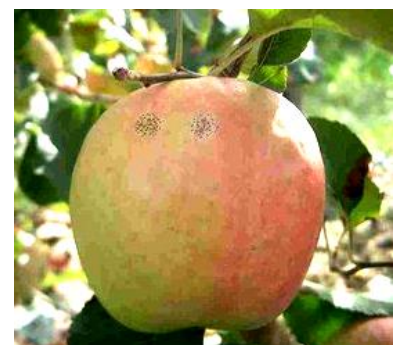
Maladie des « crottes de mouche » Photo CA82

La biologie de ces deux maladies reste relativement mal connue. Pour les « crottes de mouche », les contaminations se feraient à partir de la chute des pétales mais les symptômes