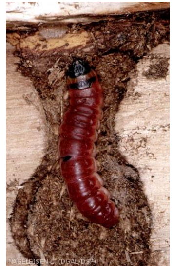
Larve de cossus

Un piège à phéromone permet de détecter les vols. Sur notre réseau, des captures ont été enregistrées fin juin.