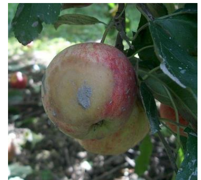
Phytophthora sur fruits - Photo CA82

Le Phytophthora est une pourriture ferme, de couleur brune. Elle affecte généralement des fruits souillés par la terre lors des pluies (fruits proches du sol) ou de la récolte.