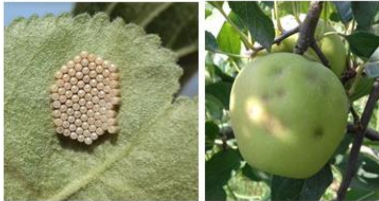
Œufs de N. viidula et dégâts estivaux de punaises sur fruits

On observe une augmentation sensible des niveaux de piégeages depuis début juillet, avec présence, entre autres, de punaise diabolique (adultes et larves).