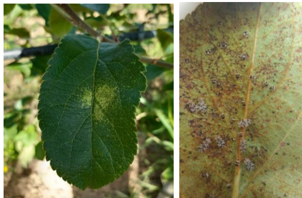
Tigre du poirier : Décoloration des feuilles à la face supérieure (à gauche) et traces d'excréments à la face inférieure (à droite)