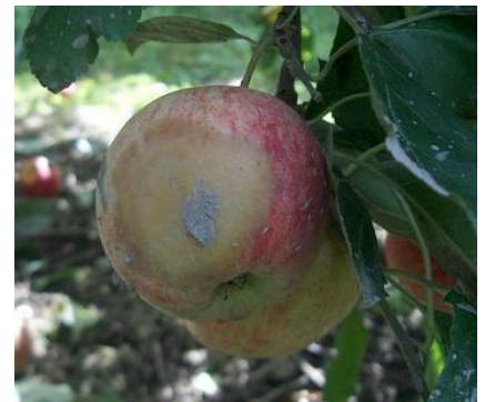
Phytophthora sur fruits

Le Phytophthora est une pourriture ferme, de couleur brune. Elle affecte généralement des fruits souillés par la terre lors des pluies (fruits proches du sol) ou de la récolte.