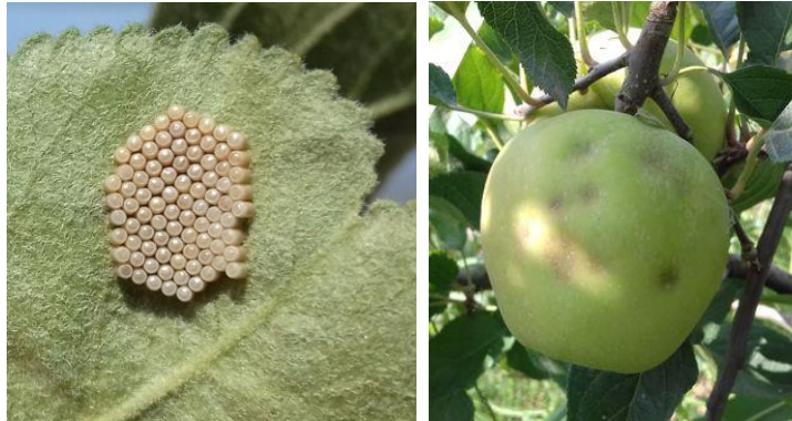
Œufs de N. viridula et dégâts estivaux de punaises sur fruits

Sur notre réseau de piégeage , nous capturons des adultes depuis début mai (date de pose des pièges) et des larves depuis mi-juin. Les premières captures de punaises diaboliques ont été enregistrées le 11 mai. Depuis mi-août, nous capturons beaucoup de larves de punaises diaboliques. Pour l'instant nous observons assez de dégâts sur fruits.