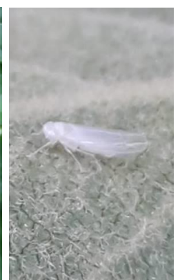
Cicadelle verte (dégâts et insecte)