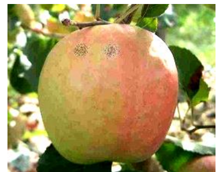
Maladie des « crottes de mouche »

La biologie de ces deux maladies reste relativement mal connue. Pour les « crottes de mouche », la contamination se ferait dans les jours qui suivent la chute des pétales