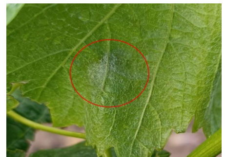
Oïdium sur feuille

Tous secteurs confondus, la maladie est présente dans 16 % des parcelles du réseau d'observation, cette proportion est stable par rapport à la semaine dernière.