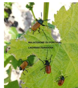
Malacosomes du Portugal et Lachnaia paradoxa