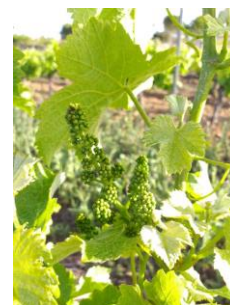
Boutons floraux séparés (stade 17 ou H ou BBCH 57).

Le stade « boutons floraux séparés » (stade 17 ou H ou BBCH 57) est majoritairement observé.