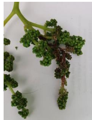
Pourriture grise sur inflorescence

Évaluation du risque : le risque est faible mais les conditions climatiques sont favorables au développement du champignon.