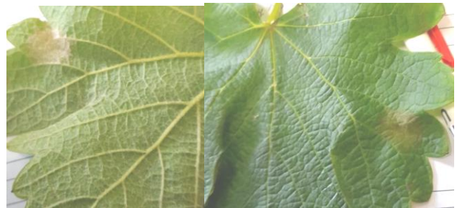
Foyer primaire sur Sauvignon blanc

Un nouveau foyer primaire a été découvert sur le Limouxin (Pauligne) et le Carcassonnais (Cavanac sur cépage Pinot noir). La fréquence des foyers primaires est très faible pour l'ensemble du département. Il n'a pas été repéré de foyers primaires sur une parcelle de Marselan sensible non protégée sur la commune de Fleury d'Aude.