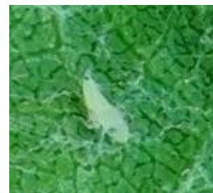
Larve de Scaphoideus titanus L1

Les 1 ères cicadelles de stade L1 sont observées au vignobles dans le secteur de la Plaine Nord (commune de Pia et Torreilles).