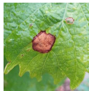
Tache de black rot avec pycnides

De rares symptômes sur feuilles ont été observés dans une parcelle du secteur des Aspres 1 ers Coteaux.