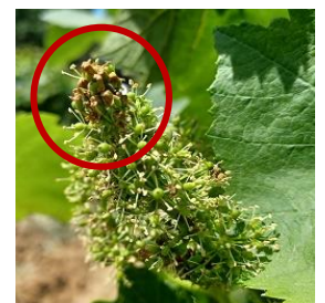
Glomérule sur inflorescence en pleine fleur

On note globalement une augmentation des effectifs en 1 ère génération par rapport à 2021.