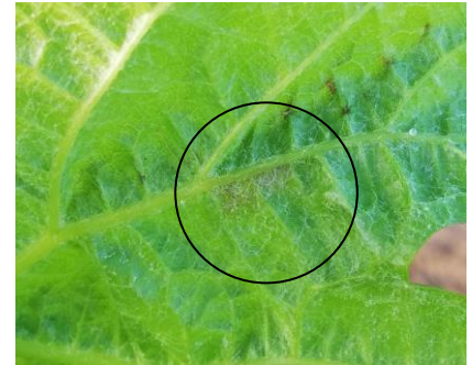
Symptôme d'oidium sur feuille de Carignan

Surveiller les symptômes dans toutes les situations.