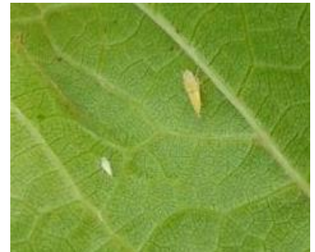
Larves (L1 et L3) de Scaphoideus titanus

- par le matériel de multiplication : la transmission de la flavescence dorée ou du bois noir aux jeunes plants est possible par les greffons et les porte-greffes, peut-être évité par le traitement à l'eau chaude.