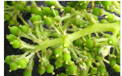
Symptôme d'oidium sur jeune grappe