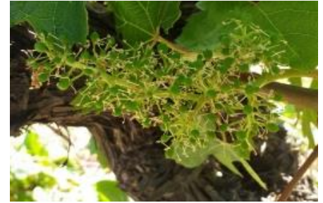
Stade « nouaison » (stade 27 ou J ou BBCH 71)

Le stade « nouaison » (stade 27 ou J ou BBCH 71) est observé avec environ 10 à 12 jours d'avance par rapport à 2021.