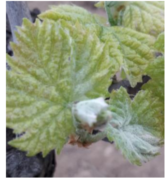
Symptômes d'oidium : drapeau sur Carignan

Les 1 ers drapeaux sont visibles sur des Carignan avancés au-delà de 2 ou 3 feuilles étalées dans le Cru Banyuls et le secteur de la Plaine.