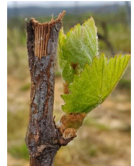
Première feuille étalée (stade 07 ou BBCH 11)

Les stades majoritairement observés sont compris entre « éclatement des bourgeons » (stade 06 ou D ou BBCH 10) et « première feuille étalée » (stade 07 ou BBCH 11).