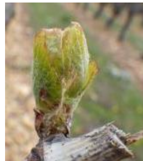
Eclatement des bourgeons (stade 06 ou D ou BBCH 10)