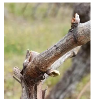
Dégâts de mange bourgeons