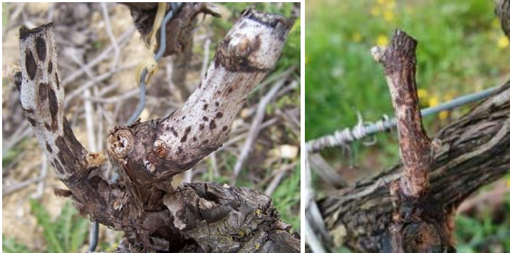
Excoriose : Symptômes sur bois et rameaux – à gauche : pycnides - à droite : excoriation sévère

Les symptômes sont importants et présents dans les parcelles à historique connu. La maladie est en recrudescence notamment sur cépages sensibles (Grenaches) à la faveur des conditions climatiques pluvieuses et humides.