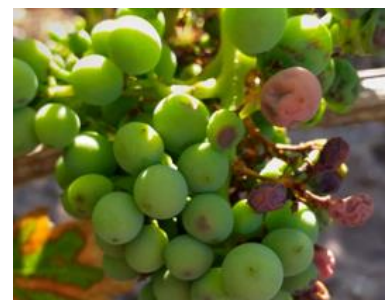
Faciès « rot brun »

Ailleurs sur le département on note également des sorties de taches qui sont de faibles intensités dans la plupart des cas. Et la fréquence des parcelles présentant de nombreux symptômes reste très faible.