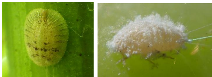
Cochenille Lécanine (à gauche) et Cochenille farineuse (à droite)

Une augmentation de la présence de cochenilles est observée dans le vignoble départemental. Elles étaient très peu présentes jusqu'à cette semaine.