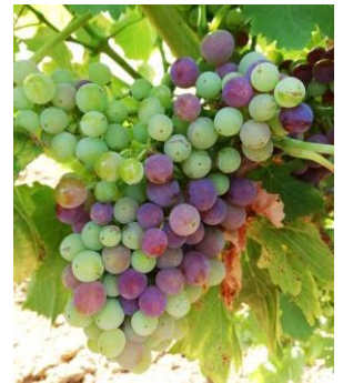
Stade « mi véraison » (stade 36 ou M ou BBCH 85)

Le stade dominant est « fermeture de la grappe » (stade 33 ou L ou BBCH 77).