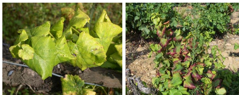
Symptômes sur cépage blanc (à gauche) et cépage rouge (à droite)