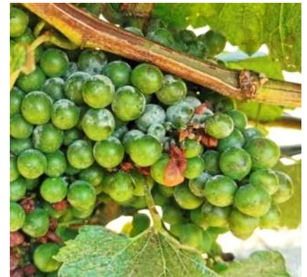
Symptômes d'oïdium sur grappe (juillet 2020)

L'oïdium est bien présent et quelques parcelles ont des fréquences et des intensités d'attaques importantes.