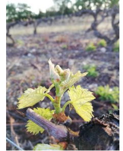
3 feuilles étalées (stade 09 ou E ou BBCH 13)

Les stades majoritairement observés sont « 2 ou 3 feuilles étalées » (stade 09 ou E ou BBCH 12-13) et « 5 ou 6 feuilles étalées, inflorescences visibles » (stade 12 ou F ou BBCH 14-53).