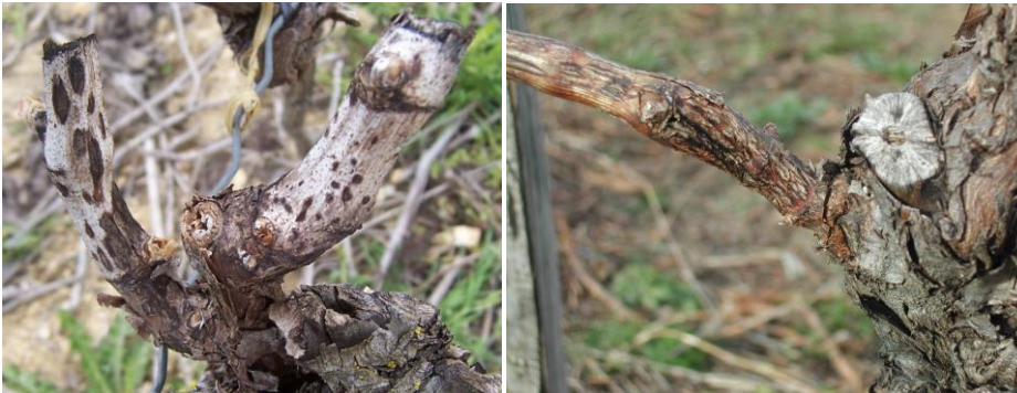
Excoriose : Symptômes sur bois et rameaux – à gauche : pycnides - à droite : excoriation sévère