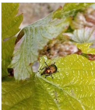
Adulte de cigarier sur Chardonnay

Évaluation du risque : Le risque reste faible.