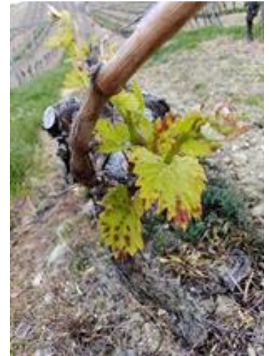
Symptômes sur Chardonnay

Evaluation du risque : le risque est faible à ce jour.