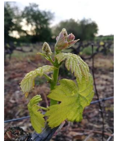
4 feuilles étalées (stade E-F ou BBCH 14)

Dans quelques rares situations (Chardonnay, Muscats), certaines parcelles très précoces et taillées tôt atteignent le stade « boutons floraux séparés » (stade 17 ou H ou BBCH 57).