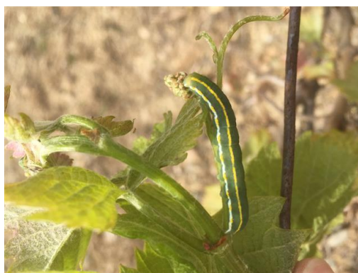
Chenille de Xylena exsoleta s'attaquant à une inflorescence sur Grenache