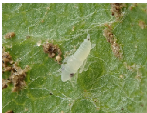
Cicadelle Scaphoideus titanus de stade L1