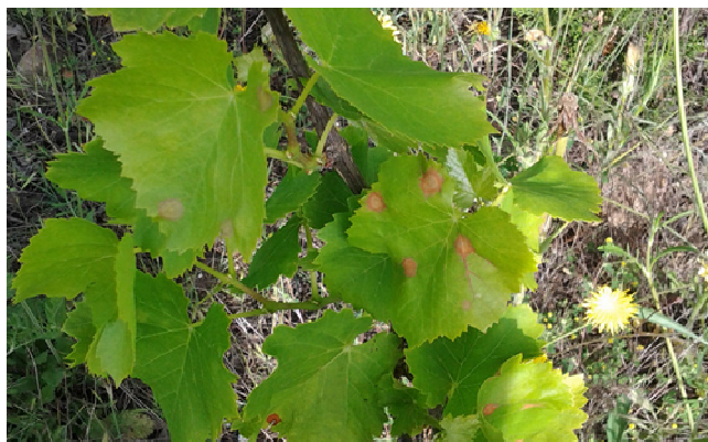
Taches de black rot