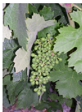
Baies à taille de pois (stade K ou 31 ou BBCH 75)