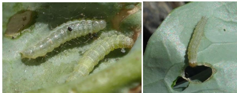
Piéride du chou et dégâts – Photo CA30

- L'utilisation de moyens de bio-contrôle est possible et efficace. Consultez la liste des produits de bio-contrôle en cliquant ici et contactez votre technicien.