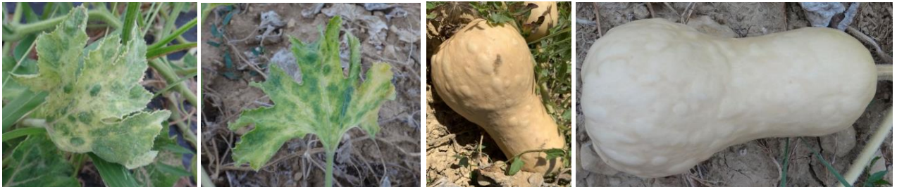
Virus sur feuilles et fruits