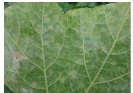
Oïdium - Photo CA30