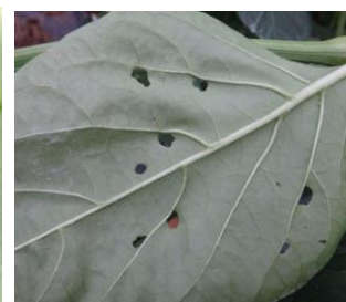
Œufs de noctuelle - Chenille et dégâts sur feuilles