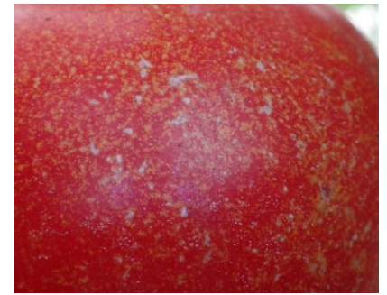
Dégâts d'acariens

- Action secondaire intéressante de Macrolophus pygmaeus sur les petits foyers.