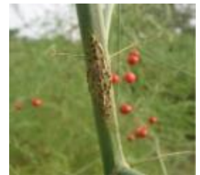
Rouille de l'asperge

Evaluation du risque : Risque à surveiller.