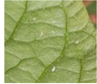
Aleurodes sur tomate

- L'utilisation de moyens de bio-contrôle est possible et efficace. Consultez la liste des produits de bio-contrôle en cliquant ici et contactez votre technicien.