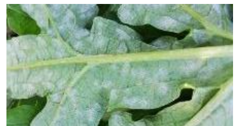
Oïdium sur artichaut

- L'utilisation de moyens de biocontrôle est possible. Liste des produits de biocontrôle . Contacter votre technicien.