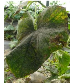
Pucerons et larves de cécidomyies sur concombre- Foyer de pucerons - Fumagine