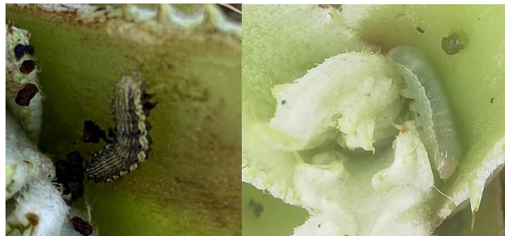
Larve Héliothis (Gauche)- Autographa Gamma (Droite)

- L'utilisation de moyens de bio-contrôle est possible et efficace. Consultez la liste des produits de bio-contrôle en cliquant ici et contactez votre technicien.