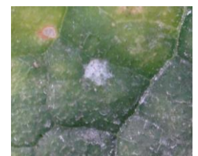
Oïdium sur concombre Photo CA30