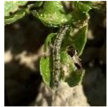
Chenille de noctuelle sur céleri - Photo CA66

- L'utilisation de moyens de bio-contrôle est possible et efficace. Consultez la liste des produits de bio-contrôle en cliquant ici et contactez votre technicien.