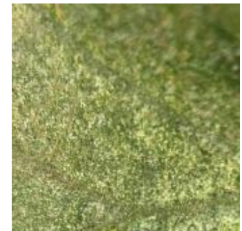
Dégâts d'acariens sur concombre Photo CA66