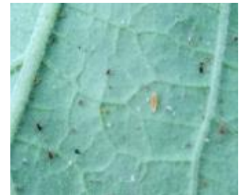
Pucerons sur aubergine avec larve d' Aphidoletes – Photo CA30