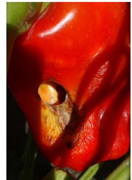
Dégât noctuelle sur fruit