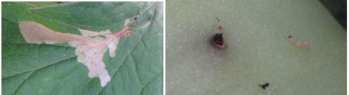
Dégâts de Tuta sur feuilles et sur fruits et larve