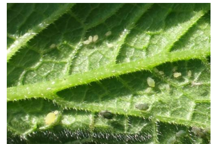
Foyer de pucerons

- L'utilisation de moyens de bio-contrôle est possible grâce à une dérogation. Consultez la liste des produits de bio-contrôle en cliquant ici et contactez votre technicien.