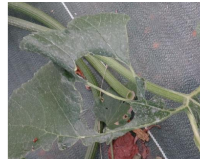
Dégâts de noctuelles sur feuille - Photo CA30

- L'utilisation de moyens de bio-contrôle est possible sur jeunes chenilles. Consultez la liste des produits de bio-contrôle en cliquant ici et contactez votre technicien.