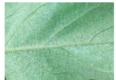
Dégâts acariens