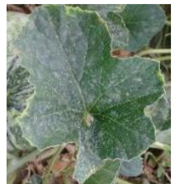
Oïdium - Photo CA30