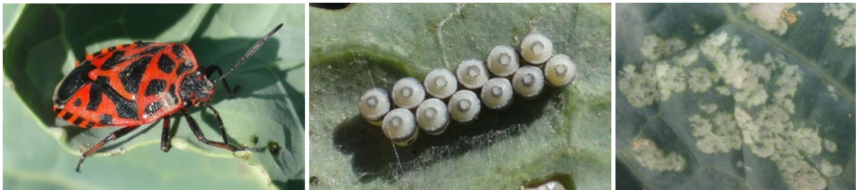
Eurydema ornata – Ponte - Dégâts – Photos CA30

- Possibilité de mettre en place des filets.