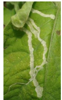
Galerie de mineuse - Photo CA30