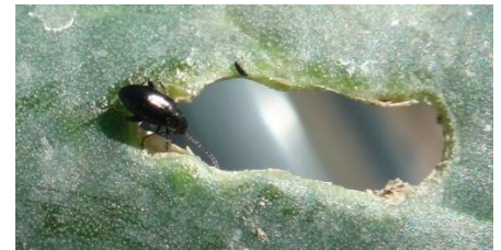
Altises sur chou

- Possibilité de mettre en place des filets.