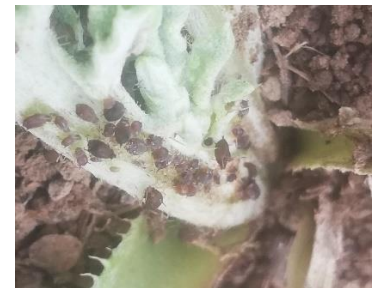
Foyer pucerons noirs

- L'utilisation de moyens de bio-contrôle est possible et efficace. Consultez la liste des produits de bio-contrôle en cliquant ici et contactez votre technicien.