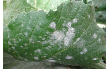
Oïdium sur courgette