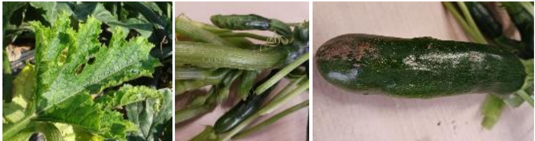
Virus sur feuille – Photo CA30 – Virus sur fruits – Photos JEEM

Selon les endroits nous observons des symptômes de virus aussi bien sur les feuilles que sur les fruits. Plusieurs analyses sont en cours dans le Gard