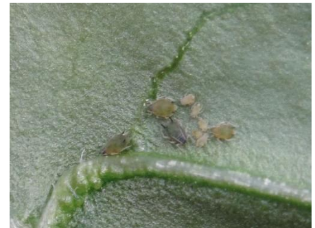
Foyer de pucerons