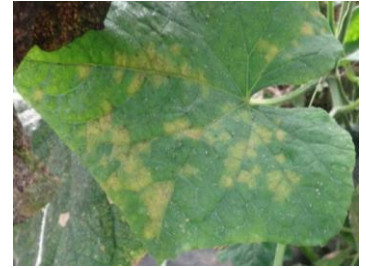
Mildiou - Photos CA30