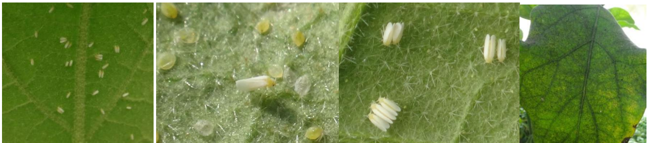
Bemisia tabaci adultes et larves - Fumagine