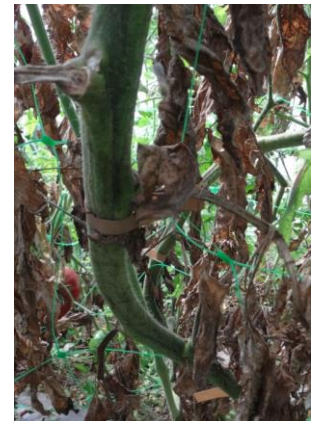
Acariose bronzée – Photo CA30