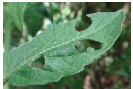
Dégâts de noctuelles- Photo CA30