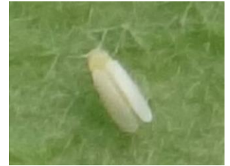
Bemisia tabaci – Photos CA30