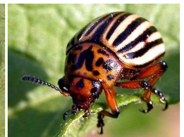
Œufs, larves et adulte de doryphores