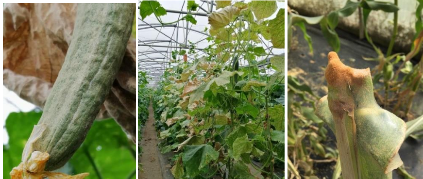
Dégâts d'acariens

- Il est possible de faire des lâcher d'auxiliaires comme Néoseiulus californicus , Amblyseius andersonii et Phytoseiulus persimilis