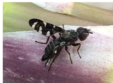
Mouche de l'asperge