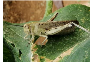
Dégâts de criquet