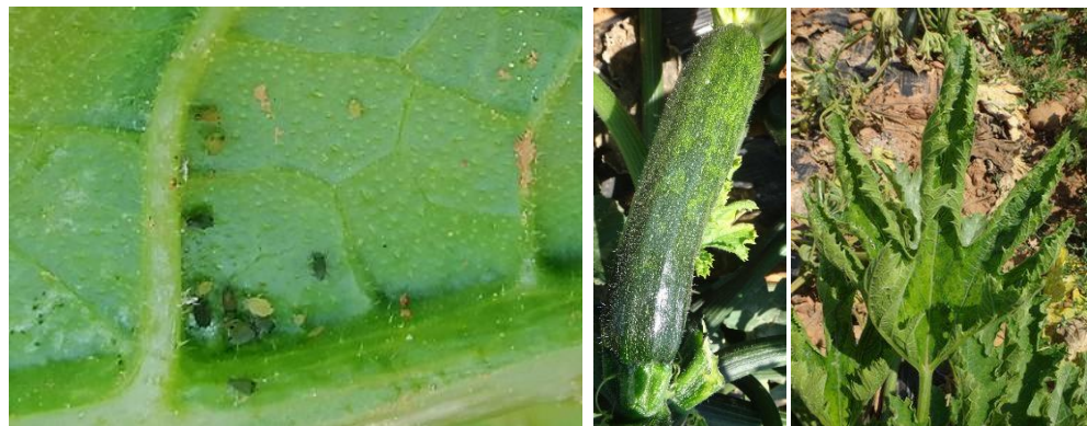
À gauche : Populations de pucerons – Photo JEEM – à droite : Symptômes de virus – Photos CA30

Techniques alternatives : favoriser l'installation des auxiliaires indigènes comme les chrysopes, les syrphes et les coccinelles.