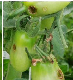
Noctuelle - Déjections et dégâts