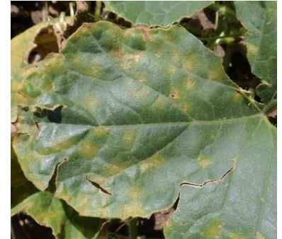
Mildiou - Photo CA30

Ce pathogène apprécie particulièrement les fortes hygrométries survenant en périodes de brouillards, de rosées, de pluies et d'irrigations par aspersion. La présence d'eau libre sur les feuilles est indispensable à l'infection qui a lieu. L'absence d'épisodes pluvieux et l'ensoleillement à venir devraient limiter les risques