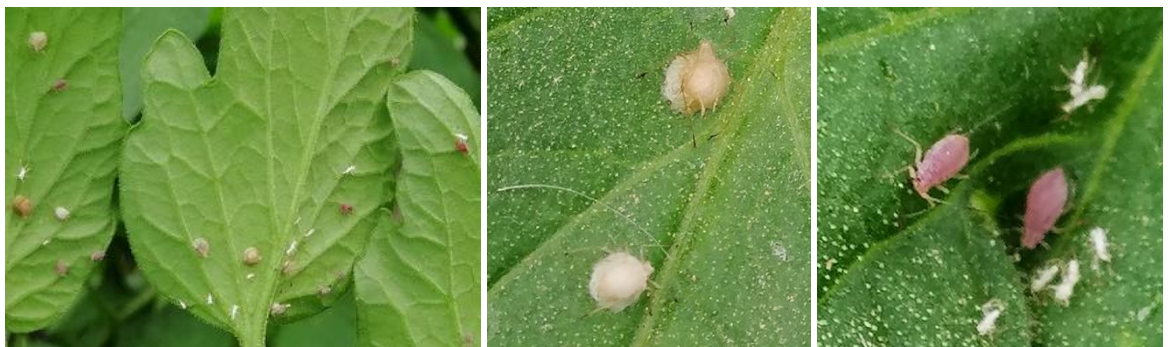
Parasitisme sur pucerons

De gauche à droite : Bon parasitisme - Puceron parasité par un praon - Macrosiphum