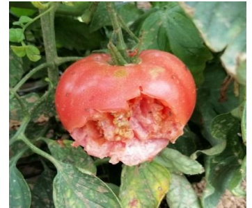
Dégâts d'oiseaux

Nous observons de manière régulière des symptômes de carences en particulier carence en magnésium, en azote (des analyses ont été réalisées) et carences en phosphore. Ces carences peuvent être induites, c'est-à-dire que les éléments sont bien présents mais ne sont pas disponibles pour les plantes.