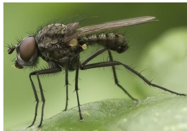
Mouche des semis