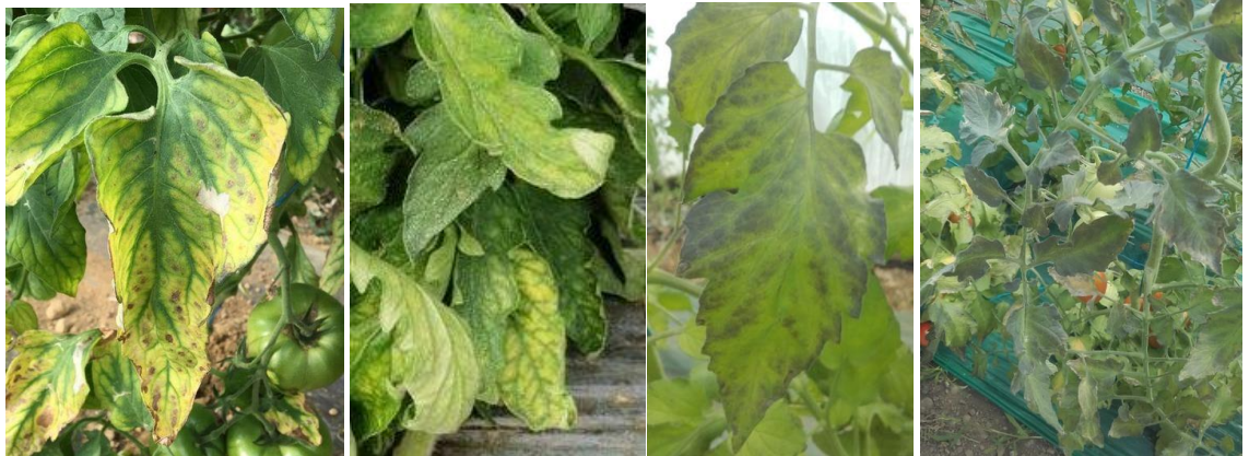
Symptômes de carences - Photos CAPL et CA 30

De gauche à droite : Carence en azote - Carence en magnésium - Carence en phosphore