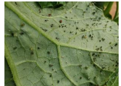
Pucerons sur melon

Des foyers de pucerons sont parfois encore observés. Un des principaux pucerons observé est Aphis gossypii dont l'adulte est reconnaissable grâce à ses cornicules noires. Nous avons des niveaux d'attaque de 0 à 1