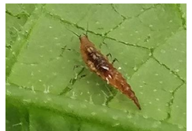
Œuf et larve de chrysope