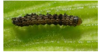
Noctuelle- Photo CA 30

Ponctuellement nous avons observé des dégâts de criquets sur feuilles dans les cultures de courgettes de plein champ