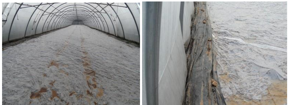
Solarisation sous abris