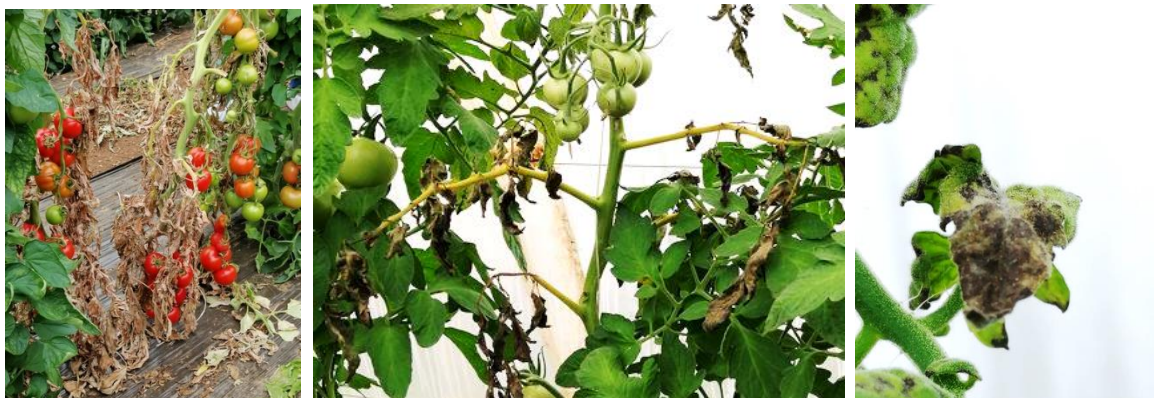
Pourriture sur tomate