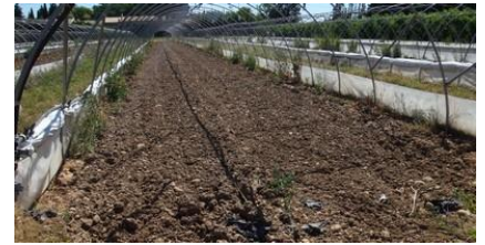
Cultures sous tunnel juste arrachées Photo CA30

Il est conseillé d'alterner 1 an sur 2 (voire sur 3) la solarisation avec un engrais verts car la solarisation peut désorganiser la biodiversité dans le sol et réduire le taux de matière organique