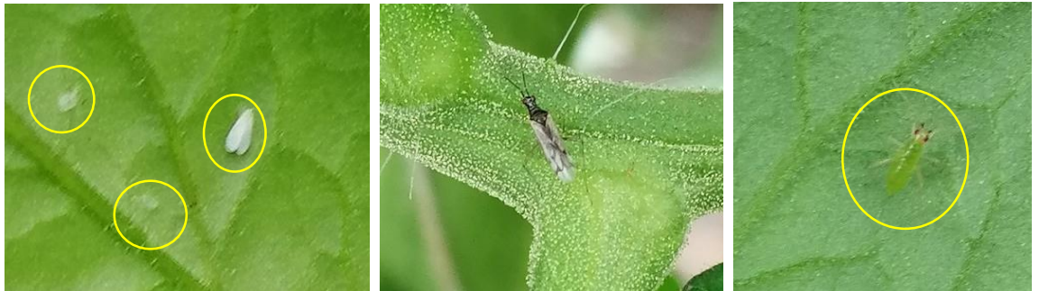
Aleurodes et auxiliaires sur tomate

De gauche à droite : adulte et larves d'aleurodes - Adulte de Dicyphus - Larve de Nesidiocoris ( Cyrtopeltis )