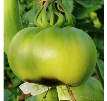
Symptôme de Cul noir

Mesures prophylactiques : Bien gérer l'irrigation tant au niveau des quantités que de la régularité et amener du calcium au goutte à goutte ou en foliaire (25-50 kg/ha de Nitrate de Chaux/semaine au goutte à goutte).