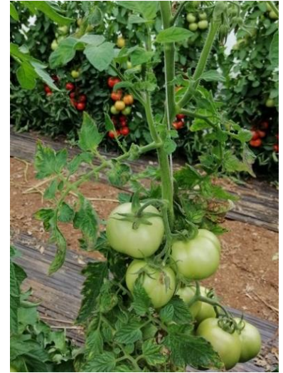
Symptômes de TSWV

- Possibilité de mettre en place de pièges englués bleus pour suivre les vols et faire du piégeage massif . Possibilité d'y associer des capsules qui contiennent une phéromone sexuelle d'agrégation qui attire les mâles et les femelles adultes du thrips californien ( Frankiniella occidentalis ). La phéromone attire deux à trois fois plus de thrips sur le panneau adhésif en comparaison avec l'utilisation du piège adhésif seul, ce qui permet une détection plus précoce