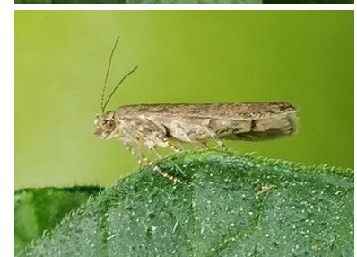
Dégâts et adultes de Tuta absoluta