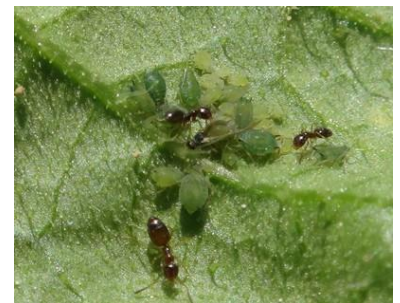
Aphis gossypii - Photo CA30

Mesures prophylactiques : il faut être vigilant pour détecter les premiers foyers et arracher les plants infestés.