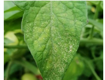
Attaques sévère acariens