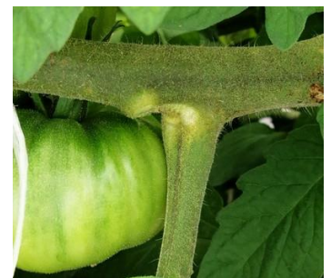
Acariose bronzée

Techniques alternatives : L'utilisation de moyens de bio-contrôle est possible et efficace. Liste des produits de bio-contrôle . Contacter votre technicien.