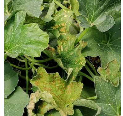
Grille physiologique

Techniques alternatives : Utilisation possible dès le stade abricot de produit à base de Nitrate de Calcium et de sulfate de Magnésie