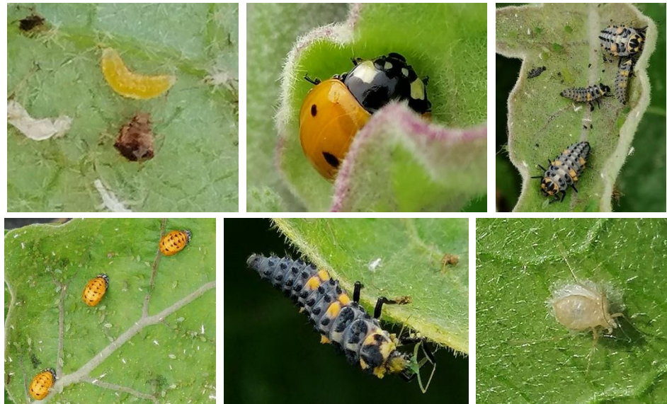
Parasitisme sur pucerons - Photos JEEM

En haut : Auxiliaires de pucerons : Larve Aphidoletes - Adulte et larves de coccinelles