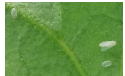
Aleurode Trialeurodes vaporariorum

- Il est possible de faire de la détection de vol et du piégeage massif avec la mise en place de panneaux englués jaunes