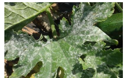
Oïdium – Photo CA30

Mesures prophylactiques : L'utilisation de variétés avec des tolérances intermédiaires à l'oïdium permet de limiter la maladie