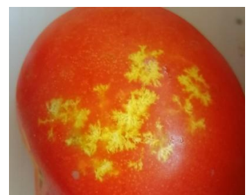
Dégâts de punaise