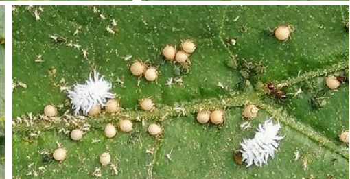
Parasitisme sur pucerons

En haut : Larves de coccinelles et puceron parasité par un Praon