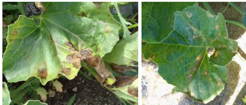
Bactériose sur feuilles