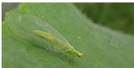
Chrysope : adulte

Possibilité de faire des lâchers de chrysope, 5 individus /m 2 .