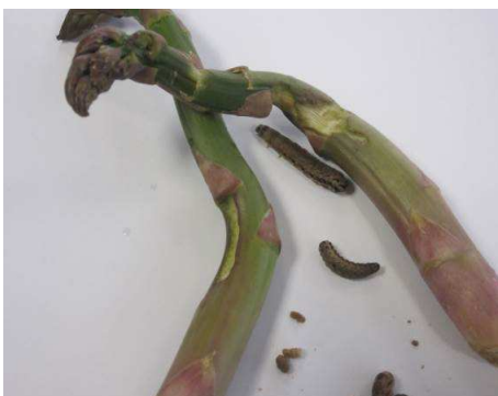
Un cas de de dégât de chenille phytophage est détecté causant des dégâts importants sur les turions d'asperge verte.