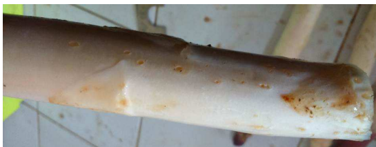
Turions présentant des dégâts de myriapodes

En asperge blanche des dégâts de myriapodes (multiples petits trous) et de taupins (gros trou) sont observés sur les turions.