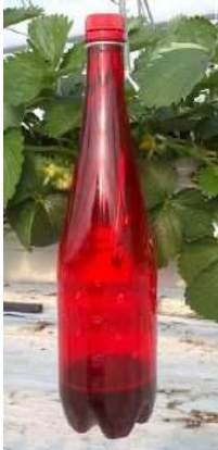
Piège « Maison »

Les déchets et fruits avec dégâts doivent être éliminés en les enfermant dans une cuve ou un sac plastique fermés hermétiquement et placés en plein soleil. Enfin, garder une fréquence de récolte régulière, rapprocher les récoltes et éviter de laisser des fruits en surmaturité sur les plantes.