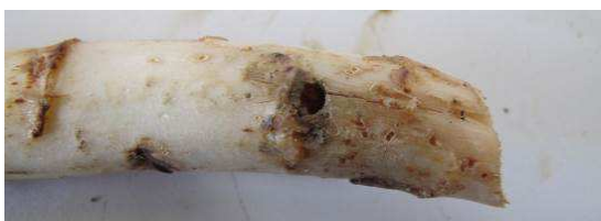
Turions présentant des dégâts de taupins