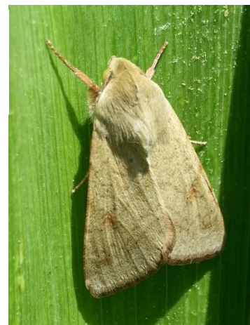
Papillon d'H. armigera - Ph Papillon d'H. armigera - Photo FREDON Aquitaine

Les pièges sont mis en place depuis près d'un mois ce qui nous permet aujourd'hui d'avoir une bonne vision de l'activité du ravageur.