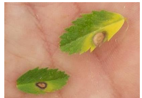
Symptômes d'ascochyte sur feuilles

La période d'observation habituelle de la maladie se situe autour de la floraison. Les symptômes de l'ascochyte sont reconnaissables grâce aux nécroses avec cercles concentriques de pycnides sur feuilles, tiges et gousses (voir photo ci-contre). La maladie se conserve sur les résidus de culture et les semences.