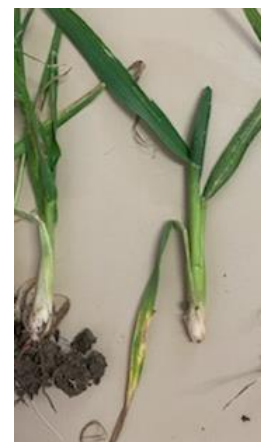
Dégâts de mouche ; pied en poireau et dernière feuille courte

Plante : La dernière feuille reste verte mais est beaucoup plus courte. Elle a du mal à s'extraire de la gaine foliaire. Le symptôme caractéristique est au niveau du pied : le pied est épaissi, en forme de poireaux. Seul le maître brin semble être touché. La larve est visible en découpant la tige. Elle dévore l'épi.