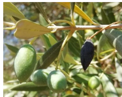
Chute physiologique d'olive

Des chutes physiologiques ont été observées sur l'ensemble des secteurs. Les olives noircissent, sèchent et finissent par tomber.