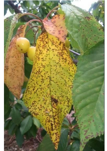
Taches sur feuilles de cerisier dues à la cylindrosporiose

Évaluation du risque : Période d'extériorisation des symptômes en cours.