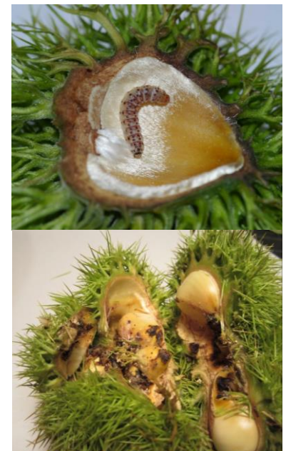
Larves et dégâts de Pammene fasciana

A la même époque en 2017, la parcelle de référence de Marigoule à Cognac comptait déjà 25% de bogues attaquées par la tordeuse.