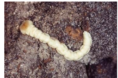
En haut : capnode adulte sur une branche – Photo CA34