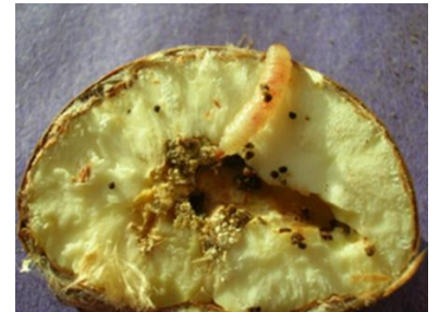
Larves et dégâts de Cydia splendana

Evaluation du risque : Les premières attaques concerneront d'abord les variétés précoces comme Bouche de Bétizac. Le risque sera élevé à partir de début août.