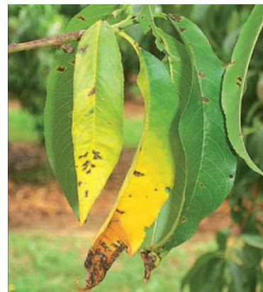
Taches sur feuilles de pêcher dues à X. arboricola

Évaluation du risque : Le risque augmente légèrement et peut s'amplifier en cas d'épisode orageux. Les fruits momifiés laissés sur les arbres constituent une source d'inoculum importante.