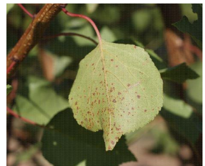
Rouille sur la face inférieure d'une feuille d'abricotier

Évaluation du risque : Période d'extériorisation des symptômes sur feuilles. Risque de contamination sur verger à historique en cas de pluie.