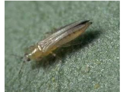
Adulte de thrips californien

Dans les deux bassins , présence dans l'enherbement, migration sur pousses et fruits s'accompagnant de dégâts sur fruits. Ces dégâts sont en augmentation dans le Roussillon .