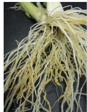
Plantes présentant des galles sur le site 2 : de gauche à droite : roquette cultivée, mâche et oignon