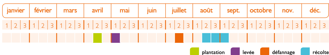
Schéma du cycle de production

Exemple pour une culture de pomme de terre de conservation type Ditta à destination du marché du frais.