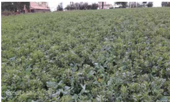
Le colza & ses légumineuses compagnes au 30 novembre