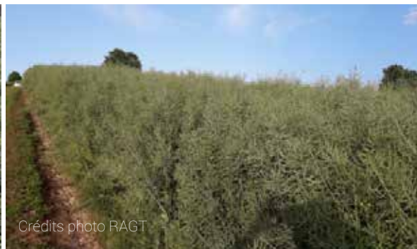
Le colza au 04 mai