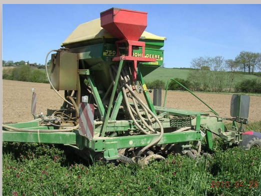
Semis de soja dans un couvert vivant avec le JD 750 A.

Un essai de SD de soja sous couvert de féverole vivante a été mené cette année, la technique va être généralisée pour la suite.