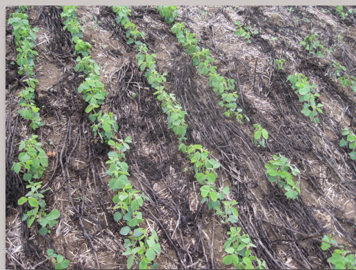
Le soja a bien levé dans les résidus de féverole plaqués au sol.