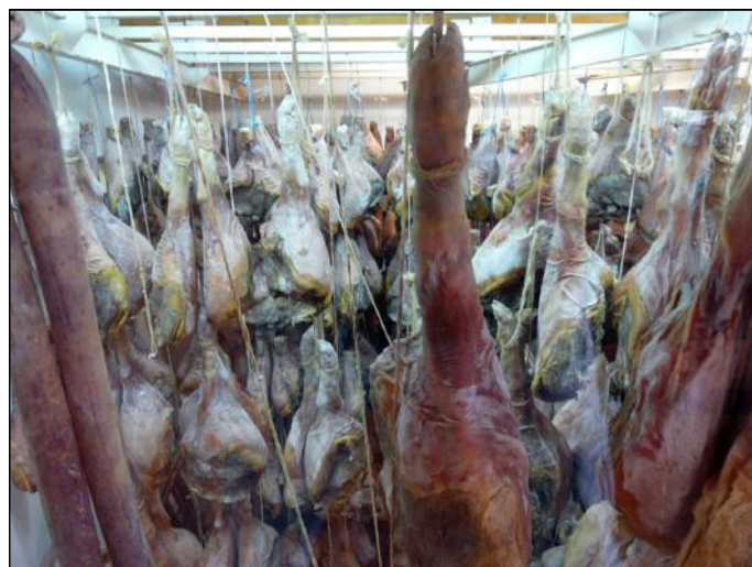
Séchoir à jambon