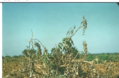
Acariose bronzée

Acariens : les fortes chaleurs de l'été ont favorisé le développement des acariens. Il a été remarqué également des dégâts d'acariose bronzée