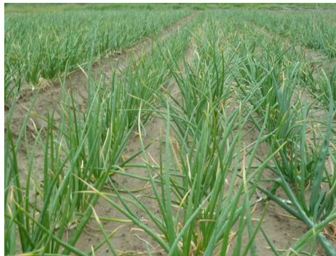
Symptômes de botrytis squamosa sur oignons : pointes jaunes.

Ce bio-agresseur a été présent toute la saison avec une pression plus importante en début de printemps. Il a toutefois été relativement bien contenu.