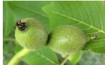
A droite : noix bactériosée – A gauche : noix saine

Quelques petites taches sont observées de manière diffuse sur les feuilles et les fruits.