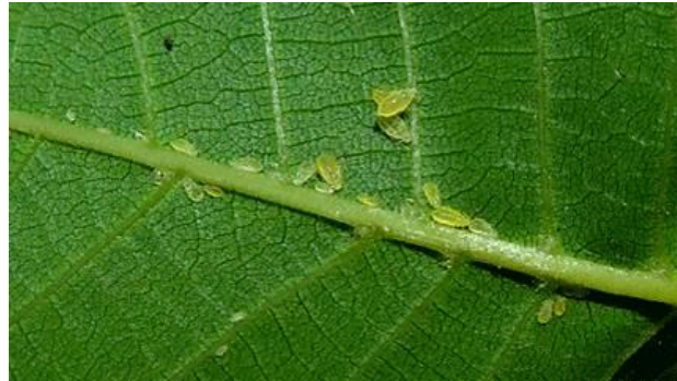
Callaphis juglandis - Chromaphis juglandicola

D'une part, les pucerons pompent la sève des feuilles par leurs piqûres et d'autre part, ils sécrètent un abondant miellat sur lequel se développe un champignon, la fumagine.