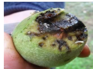
Dégâts de mouche du brou

Les dégâts sont dus au développement des larves dans la partie charnue du fruit (le brou de la noix), la rendant molle, humide et noire. Les premiers signes d'infestation sont de petites taches noires sur le brou créées par la cicatrice de ponte ; ceux-ci peuvent être confondus avec ceux de la bactériose. Pourtant en regardant de plus près, le brou est noirci mais pas visqueux.